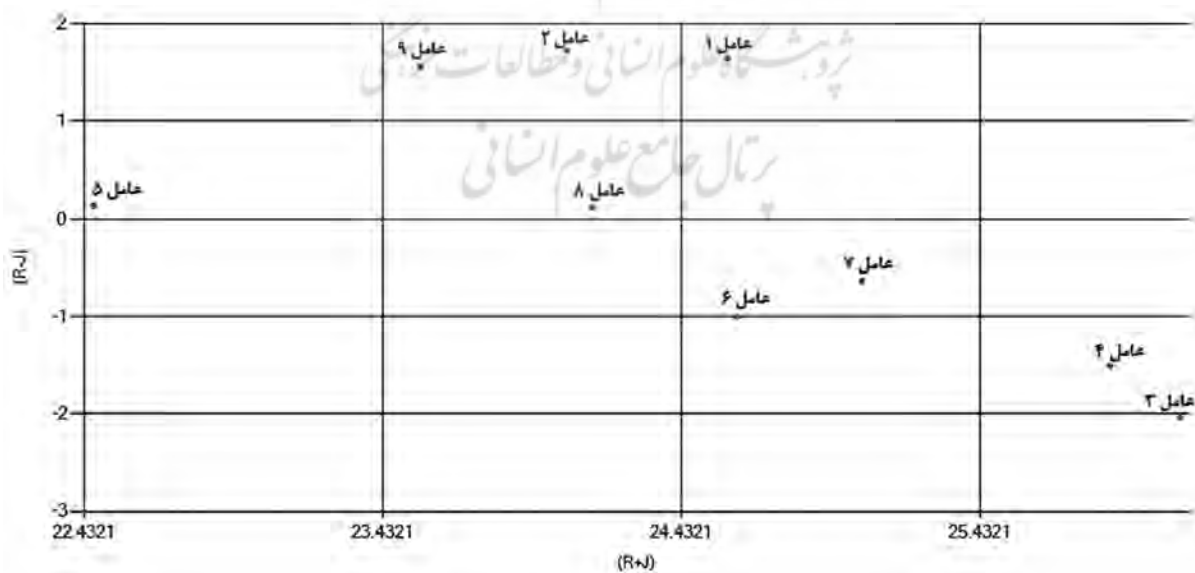
نمودار ۳- نمودار علی و رابطه معیارها با استفاده از روش دیمتل

در این ماتریس روی محور R+J, x و روی محور R-J, y قرار می‌گیرند. ارزش R+J اهمیت هر عامل را نشان می‌دهد و