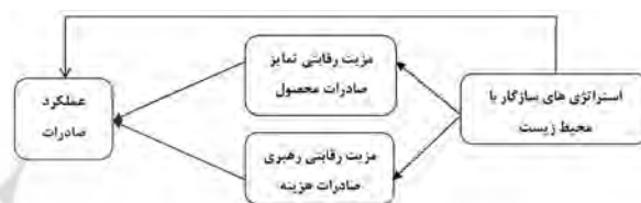
نمودار ۱- مدل مفهومی تحقیق

محیط زیست حساس هستند ابزاری برای رسیدن به مزیت رقابتی است، در حالی که این مزیت یکی از محرک‌های اصلی گرایش به سمت محیط زیست محسوب می‌شود. انواع مختلف مزیت‌های رقابتی سازگار با محیط زیست که با هزینه کم ارتباط دارند (مثلاً استانداردسازی طرح‌های محصول سازگار محیط زیست) و متمایزسازی (مثلاً با استفاده از جهت‌گیری محیط زیستی مشخصات محصول دسته‌بندی جهت ایجاد تمایز از دیگر رقبا) را از هم تفکیک می‌کند. بنابراین در نهایت مزیت رقابتی تمایز صادرات محصول و مزیت رقابتی رهبری صادرات هزینه تاثیر مثبت و معناداری بر عملکرد صادرات دارد.