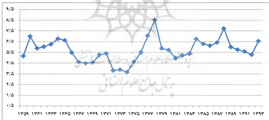
نمودار ۱. نسبت درآمدهای مالیاتی به GDP ایران (درصد)

درصد هزینه‌های دولت بزرگ‌تر از نسبت مالیات به تولید ناخالص داخلی است که این نشانه خوبی برای توسعه محسوب نمی‌شود. جدول (۱) نسبت مالیات به تولید ناخالص داخلی را برای کشورهای منتخب نشان می‌دهد که در همه کشورها به جز عمان و کویت، تلاش مالیاتی ایران از بقیه کشورها پایین‌تر است. با توجه به جمعیت پایین کشورهای عمان و کویت نمی‌توان ساختار اقتصادی آنها را با ایران مقایسه کرد ولی اغلب کشورهای قاره‌های مختلف جهان، نسبت مالیات به تولید ناخالص داخلی بالاتری داشته و سعی می‌کنند تمام یا بخش اعظم هزینه‌ها را از طریق مالیات تأمین کنند. متوسط نسبت مالیات به تولید ناخالص داخلی در میانگین جهانی معادل ۱۴ درصد (دو برابر ایران) و اروپا و آسیا معادل ۱۹ درصد (۲/۷) برابر ایران) است. در میان ۱۴۰ کشور منتخب دنیا (که اطلاعات آنها در سایت بانک جهانی قابل دسترس است) ایران دارای رتبه ۱۳۵ از نظر نسبت مالیات به تولید ناخالص داخلی است. بنابراین مشخص است که فشار مالیاتی در ایران نسبت به میانگین جهانی و بعضی از قاره‌ها یک‌دوم تا یک‌سوم است و از این منظر ایران جایگاه مناسبی نداشته است. در ایران حدود ۳۳ درصد از هزینه‌های دولت از طریق مالیات تأمین شده و