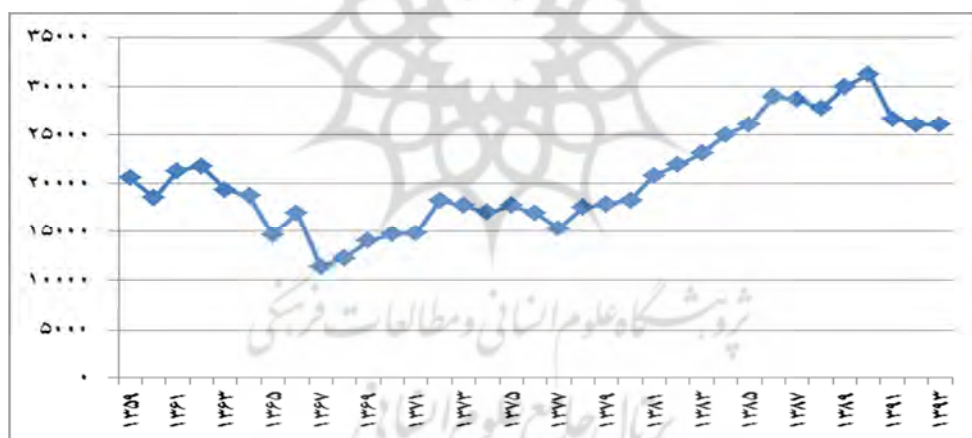
نمودار ۴. تولید ناخالص داخلی سرانه به قیمت‌های ثابت سال ۱۳۸۳ (میلیارد ریال)

نمودار (۴)، تولید ناخالص داخلی سرانه به قیمت‌های ثابت سال ۱۳۸۳ را نشان می‌دهد. ارقام حکایت از آن دارد که تولید ناخالص داخلی سرانه در اقتصاد ایران به طور متوسط حدود ۱/۳۴ درصد در سال رشد داشته است.