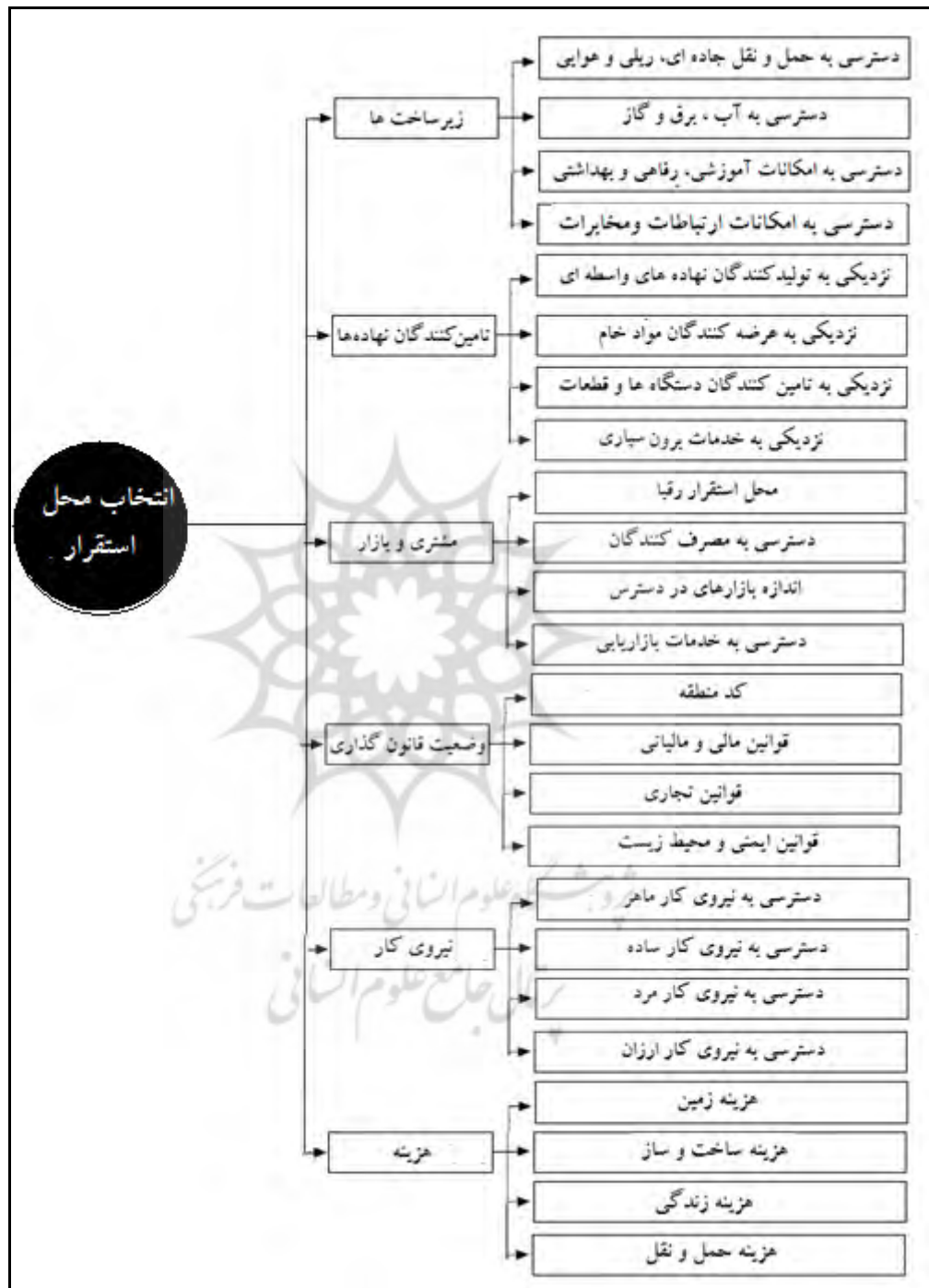
شکل ۲. درخت سلسله‌مراتبی عوامل مؤثر بر محل استقرار صنایع

با توجه به مباحث پیشین و ادبیات تحقیق، ساختار مناسب درخت سلسله مراتبی عوامل مؤثر بر محل استقرار صنایع در شکل (۲) ترسیم شده است.