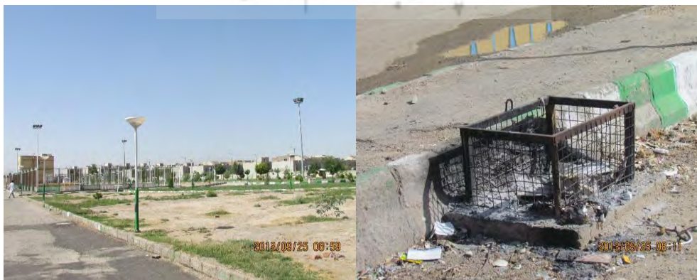
شکل ۱. نمایش از وضعیت مبلمان شهری در سطح شهر زاهدان