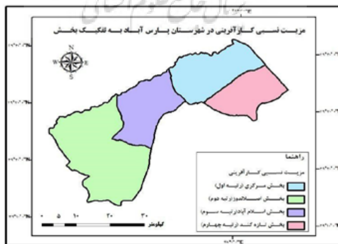
تصویر ۴. مزیت نسبی کارآفرینی روستایی شهرستان پارس‌آباد.

همچنین بررسی وضعیت گروه‌های ۱ و ۲ نشان می‌دهد که بالا بودن نرخ شاخص‌هایی همچون مرکزیت تجاری روستا، دسترسی به بازارهای شهری، وجود زیرساخت‌های بازرگانی-