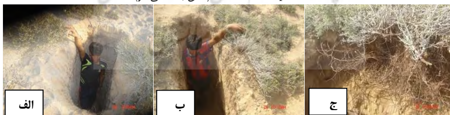
شکل ۳: الف، وجود ریشه‌های نمدی منظور استفاده از شبنم (شرجی)، ب و ج، حفر پروفیل خاک به منظور مطالعه ریشه دوانی گونه ساحلی

Subset for alpha = 0.05 (عمق به سانتی‌متر)