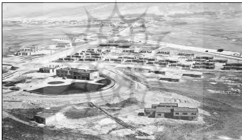
تصویر ۲- نقشه اولیه شهر یاسوج سال ۱۳۵۳ - (ماخذ: گزارش طرح هادی شهر یاسوج، ۱۳۵۵)

شهر یاسوج مرکز استان کهگیلویه و بویراحمد در شمال شرقی استان در دامنه قله رفیع دنا از سلسله جبال زاگرس با ارتفاع ۱۸۵۰ متر از سطح دریا در ۳۰ درجه، ۳۹ دقیقه و ۳۰ ثانیه عرض شمالی و ۵۱ درجه، ۳۵ دقیقه و ۴۰ ثانیه طول شرقی از نصف النهار گرینویچ واقع شده است. محیط پیرامون شهر را سراسر کوه‌های بلند و جنگل‌های سرسبز پوشانده و این شهر دارای آب و هوای سرد کوهستانی می‌باشد. شهر یاسوج در محدوده دهستان سررود شمالی از بخش مرکزی شهرستان بویراحمد قرار گرفته است و از شمال به استان اصفهان، از شرق به شهر سی سخت و از غرب به استان فارس نزدیکی دارد. اگرچه در این شهر تا سال ۱۳۵۰ توسعه شهری به صورت ضعیف و محدود به احداث تعدادی خانه سازمانی، احداث چند خیابان، مدرسه و تعدادی فضاهای تجاری و ... بوده و از نظر وسعت فضایی، سطح کوچکی را اشغال کرده بودند، اما از دهه ۶۰ به بعد همراه با افزایش تمایل به شهرنشینی، وسعت شهر نیز رشد چشمگیری به خود دید که گونه‌ای که امروزه، محدوده فضایی وسیعی را تحت اشغال خود درآورده است.