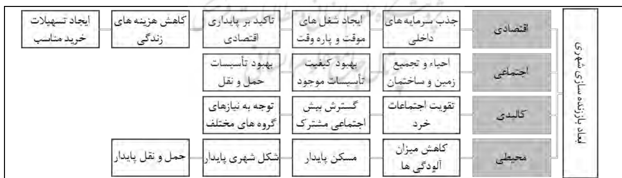
شکل ۱- ابعاد مختلف رهیافت باززنده سازی فضاهای شهری

ارکان اصلی برنامه ریزی باززنده سازی در جهت توسعه و کارآمدی: عناصر اصلی باززنده سازی در جهت توسعه و کارآمدی فضای شهری: مشارکت، راهبرد و پایداری، سه ضلع مثلث رهیافت باززنده سازی را تشکیل می دهند. هر سه ضلع مبنایی برای اقدام جامع و تفصیلی ارائه می نمایند و هر یک نقش ویژه ای را در رهیافت باززنده سازی ایفاء می کنند (Korkamaz, 2015:136). وجود نگرش چند بعدی و جامع در رهیافت باززنده سازی، سبب ساز دستیابی به نتایج بهتر در ارائه ی برنامه ی توسعه و کارآمدی شده است (Roberts and Sykes, 2014: 15).