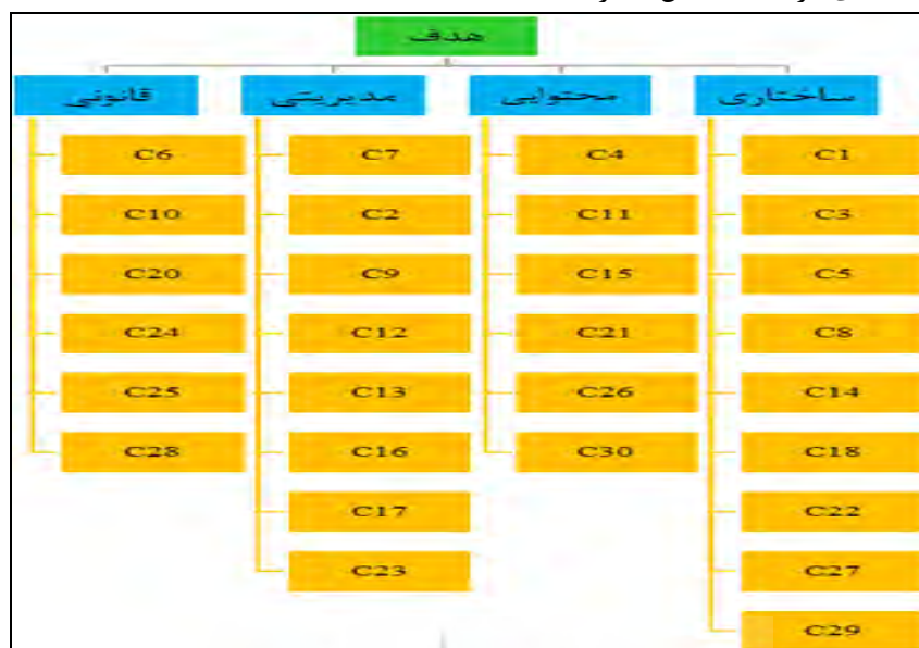
شکل ۱- خوشه بندی معیارهای مورد بررسی در نرم افزار Super Decision - مأخذ: مطالعات نگارندگان، ۱۳۹۶.

مؤلفه های تأثیر بیشتری دارند از مدل ANP استفاده شد. در ابتدا معیارهای اصلی و زیرمعیارها مؤثر در بازدارندگی تحقق طرح های آمایشی دسته بندی گردیدند. (شکل شماره ۱).