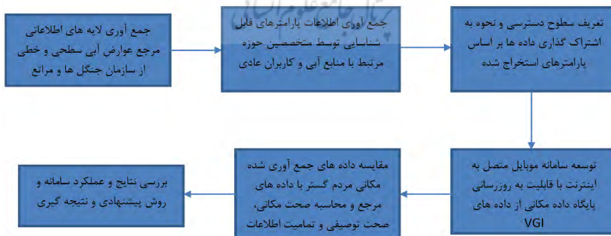
نگاره ۱: روند انجام تحقیق

سایت به عنوان نمونه‌ای از داده‌های مردم‌گستر استفاده کنند و تاکنون تحقیقات بسیاری در زمینه کیفیت داده‌های این سایت‌ها در مناطق مختلفی از دنیا انجام شده است. همچون Haklay و همکاران برای کشور انگلستان (Haklay, 2010). Girres برای کشور فرانسه (Girres et al., 2011) و Zielstra برای کشور آلمان (Zielstra et al., 2010). در واقع بحث اصلی در این نوع تحقیقات بررسی کیفیت اطلاعات مکانی مردم گستر می‌باشد. به نوعی با افزایش کیفیت این نوع داده‌ها نمادگذاری‌های خلاف واقع تعمدانه داده‌های مکانی به صورت چشمگیری کاهش می‌یابد (Senarata et al., 2015). از طرفی در به‌روزرسانی پایگاه داده، اطمینان از فراداده‌های مکانی اهمیت ویژه‌ای دارد. به خصوص فراداده‌هایی مثل کیفیت و تاریخ تولید داده‌های مکانی. پایگاه داده مکانی که دارای داده‌های باکیفیت بیشتر بسیار قابل‌اعتمادتر است و به همین دلیل داده‌ها قبل از ورود به پایگاه داده باید کیفیت سنجی شوند و داده‌های با کیفیت بالاتر جدا شوند (هنرپرور و آل‌شیخ ۱۳۹۴). کیفیت این نوع اطلاعات را می‌توان با استفاده از اندازه‌گیری‌ها و المان‌های کیفیت تشریح کرد (Antonioniou and Skopeliti, 2015) این داده‌ها ماهیت چندبعدی دارند و در مقالات و منابع علمی مختلف المان‌های متفاوتی برای کیفیت اطلاعات مکانی مردم گستر تعریف می‌شود، ولی پنج المان مهم که تقریباً در تمامی مراجع علمی مورد تأیید