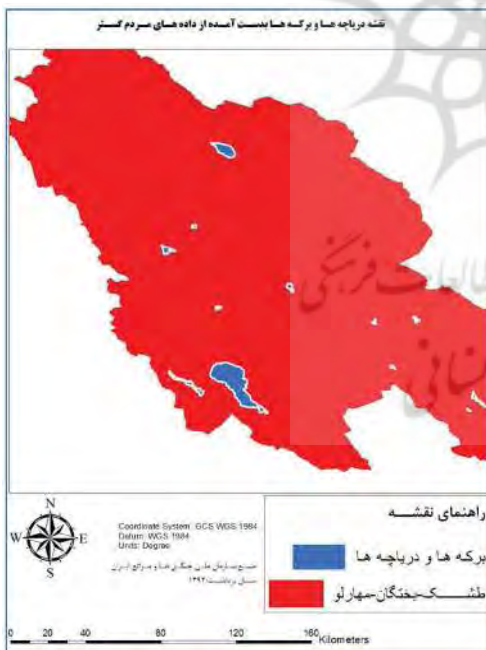
نگاره ۷: نقشه عوارض سطحی مردم گستر

نگاره‌های ۶ و ۷ شامل اطلاعات نقشه داده‌های مرجع عوارض سطحی و نقشه داده‌های مکانی مردم گستر عوارض سطحی است. نگاره‌های ۸ و ۹ به ترتیب شامل نقشه داده‌های