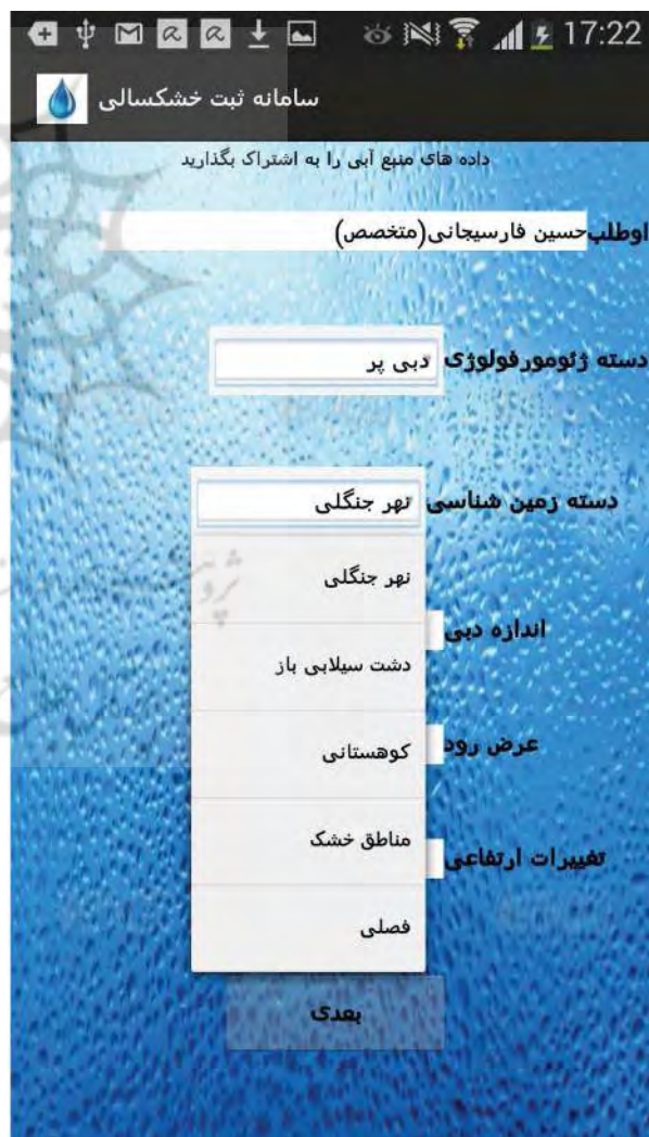
نگاره ۵: اطلاعات تکمیل شده توسط کاربران خبره در برنامه همراه

به اشتراک می‌گذارند می‌تواند اطلاعاتی درباره دسته ژئومورفولوژی عارضه آبی، اندازه دبی، دسته زمین‌شناسی، عرض دقیق عارضه، تغییرات ارتفاعی، میزان فاصله مرکز عارضه آبی خطی تا حریم رودخانه، میزان تغییر اقلیم حول عارضه آبی، میزان رسوبات و یا تغییرات رسوبی اطراف عارضه آبی، میزان دسترسی عوامل انسانی به منبع و نوع توپوگرافی منطقه را مشخص کند. این اطلاعات همراه با مختصات و زمان اخذ داده‌ها به سمت پایگاه داده مکانی ارسال می‌شود. نگاره ۵ حاوی اطلاعات به اشتراک‌گذاری شده توسط کاربر خبره در سامانه همراه می‌باشد.