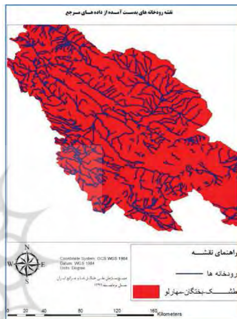
نگاره ۸: نقشه عوارض سطحی مرجع

مرجع عوارض سطحی و نقشه داده‌های مکانی مردم گستر عوارض سطحی است. پس از محاسبه مقدار تمامیت داده‌های مکانی مردم گستر برای عوارض سطحی و سطحی مقدار به دست آمده تمامیت برای تمامی عوارض ۷۵٪ به دست آمد.