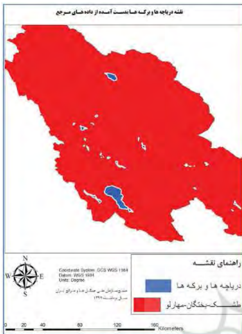
نگاره ۶: نقشه عوارض سطحی مرجع