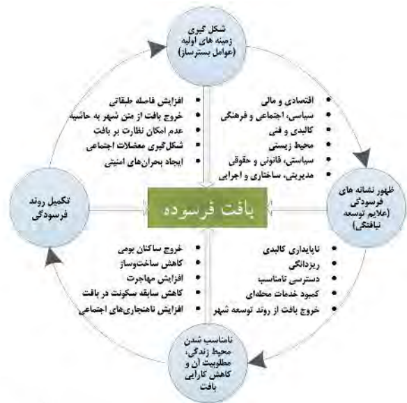
نگاره ۱: مدل مفهومی شکل‌گیری و تداوم فرسایش انواع بافت‌های فرسوده شهری (عندلیب، ۱۳۹۲: ۵۸)

مکتب‌ها و نظریه‌های متعددی در زمینه ساماندهی و بهسازی بافت‌های فرسوده و ناکارآمد شهری ارائه شده است، اما در این بین، مکتب انسان‌گرایی همانند پست‌مدرن‌ها، توجه خاصی به مردم و مشارکت آنها با حضور متخصصین و کارشناسان در امر بهسازی و نوسازی شهری دارد. از این رو، انسان‌گراها معتقدند شهروندان نقش اساسی را در ساماندهی شهری بازی می‌کنند. براین اساس در عصر حاضر، برنامه‌ریزی سنتی توان پاسخگویی به مشکلات و مسایل موجود در بافت فرسوده را دارا نیست تا بتواند برنامه‌ریزی مناسبی برای آینده بافت‌های فرسوده شهری داشته باشد. به عبارت دیگر، امروزه متون نظری برنامه‌ریزی از مفاهیم پیش‌بینی و آینده‌نگری عبور کرده و به حوزه آینده‌پژوهی یا آینده‌نگاری که وظیفه‌اش معماری آینده می‌باشد، رسیده است (فرچ‌پور و همکاران، ۱۳۹۴: ۲). آینده‌پژوهی، با تشخیص فرصت‌ها و تهدیدهای آینده (فخرایی و کقیبادی، ۱۳۹۳: ۸)، با بهره‌گیری از توانایی‌ها و استعدادها طیف متنوعی از نیروهای انسانی و مدیریت مؤثر آن (تقوی، ۱۳۹۲: ۸)، در فضایی اطمینان‌بخش و مشارکتی، آینده مطلوب را رقم می‌زند (هاشمی و همکاران، ۱۳۹۳: ۱۲). بنابراین، «مشارکت» مشخصه کلیدی آینده‌نگاری است (دوفوا و الکویست، ۲۰۱۵: ۲۵۱). به همین منظور جهت آشنایی بیشتر با خاستگاه این رویکرد نوین، دیدگاه‌های نظری مرتبط با آینده‌پژوهی نیز به طور اجمالی ارائه می‌گردد.