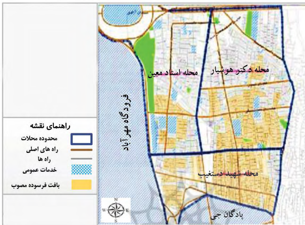
نگاره ۴: نقشه بافت فرسوده مصوب ناحیه یک (محمدی و همکاران، ۱۳۹۲: ۵۰)

در مرحله دوم به شناسایی و تحلیل اجزای سیستم پرداخته شد. در این بخش، به کمک نرم افزار میک مک متغیرها بر حسب میزان تأثیرگذاری و تأثیرپذیری متقابل مجدداً مورد ارزیابی و سنجش قرار می گیرند. بدین منظور، ماتریس تحلیل اثر متقابل متغیرها (۶۱*۶۱) ایجاد شده و به وسیله متخصصان و کارشناسان ارزیابی و ارزش گذاری می شود. ویژگی کلی ماتریس تشکیل شده در جدول (۶) ارائه شده است.