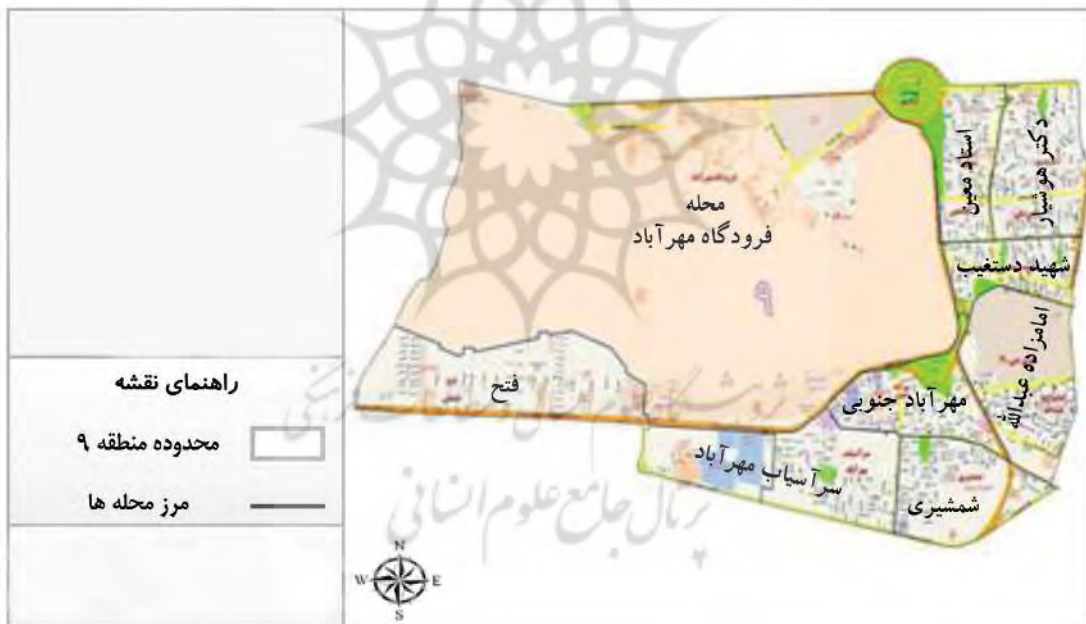
نگاره ۳: نقشه منطقه ۹ و محله‌ها (شناسنامه جامع منطقه ۹، ۱۳۹۴: ۱۱)

دستغیب سکونت دارند (سند توسعه محلات، ۱۳۹۴: ۸). منطقه ۹، از مناطق مهاجرپرست تهران محسوب می‌شود. زیرا جمعیت منطقه طی سال‌های ۱۳۹۰-۱۳۶۵ از ۱۸۹۸۰۵ نفر به ۱۵۸۴۲۵ نفر تقلیل یافته است (مرکز آمار ایران، ۱۳۹۱). ناحیه یک با جمعیتی بالغ بر ۷۰,۲۶۷ نفر و مساحت ۲۶۴