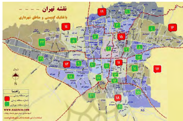
شکل ۱- نقشه شهر تهران به تفکیک مناطق