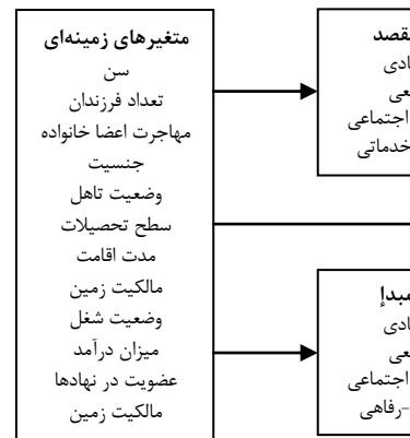
شکل (۱) مدل مفهومی پژوهش