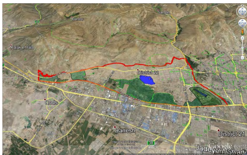
شکل ۳: خروجی حاصل از جدا کردن پهنه‌ها توسط نرم‌افزار Google Earth