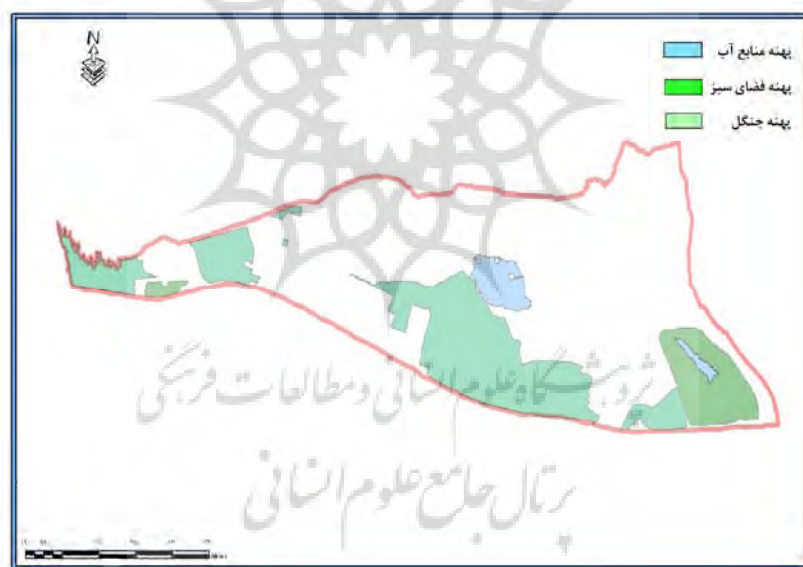
شکل ۴: انتقال و محاسبه مساحت پهنه‌ها با استفاده از Arc GIS