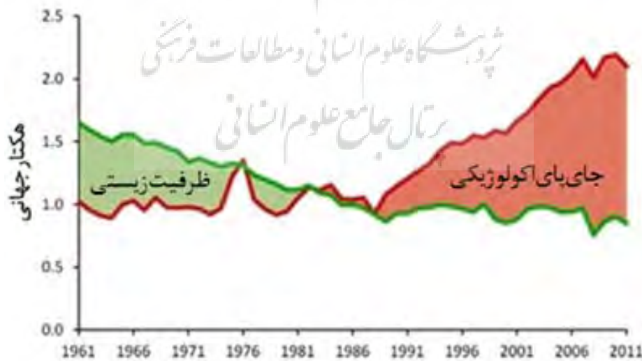
شکل ۱: ناپایداری جای پای اکولوژیکی و ظرفیت زیستی ایران در سال‌های اخیر Ecological Footprint Atlas, 2016

دگرگونی‌هایی از جمله کاهش میزان ظرفیت زیستی منطقه، اثرات اجتماعی-اقتصادی غیرقابل کنترل، هزینه‌های گزاف در جهت حفظ سلامتی و همچنین درمان بیماری‌های به وجود آمده، بوده است. به نظر می‌رسد، توسعه منطقه از حالت پایدار خارج شده است؛ از این رو، نیاز است ظرفیت زیستی را برای آن محاسبه کرده و پس از مقایسه با جای پای اکولوژیکی، وضعیت توسعه منطقه مشخص شود. در این پژوهش حد ظرفیت زیستی و میزان جای پای اکولوژیکی منطقه ۲۲ تهران محاسبه شد و در محاسبه ظرفیت زیستی این منطقه برای نخستین بار از تکنیک سنجش از دور و سیستم اطلاعات جغرافیایی براساس نرم‌افزارهای Google Earth و Arc GIS برای محاسبه ظرفیت زیستی استفاده شد. برای محاسبه ظرفیت زیستی، به مساحت نواحی موجود برای یک نوع مصرف زمین معین نیاز است که دو نرم‌افزار مذکور در این تحقیق باعث کاهش هزینه تحقیق و سهولت محاسبه این پارامتر شدند. در پایان تغییراتی در سیاست‌های مدیریتی این منطقه برای حصول توسعه پایدار پیشنهاد شد.