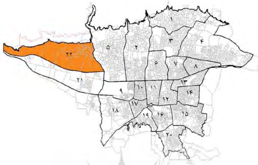
شکل ۲: موقعیت منطقه ۲۲ در منطقه‌بندی جدید شهر تهران