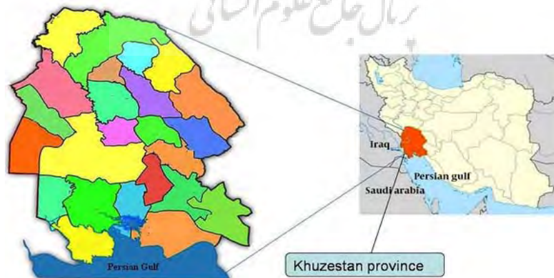
شکل ۲: نقشه استان خوزستان

استان خوزستان، استانی در جنوب غربی ایران است که در کرانه خلیج فارس قرار دارد. مساحت استان خوزستان ۶۴۰۰۵۷ کیلومتر مربع است و با جمعیتی حدود ۴/۵ میلیون نفر، به‌عنوان پنجمین استان پرجمعیت ایران محسوب می‌شود. خوزستان از شمال به استان لرستان، از شمال‌شرقی و شرق به استان چهارمحال و بختیاری، از شمال‌غربی به استان ایلام، از شرق و جنوب‌شرقی به استان کهگیلویه و بویراحمد، از جنوب به استان بوشهر و خلیج فارس و