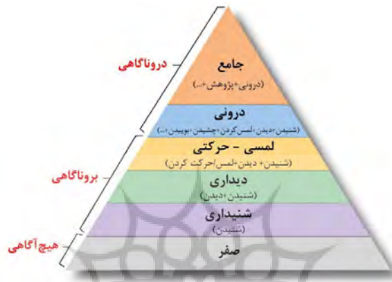
نمودار ۲: هرم هیجامد (Pishghadam, 2016)

تفحص، به هیجامد جامع از آن واژه دست یابد و خود را به مرحله درون‌آگاهی ۱۳ برساند. در این مرحله، درک کاملاً دقیقی از آن واژه یا مفهوم مورد نظر شکل خواهد گرفت. برای درک بهتر سطوح هیجامد می‌توان نمودار ۲ را نیز نشان داد: