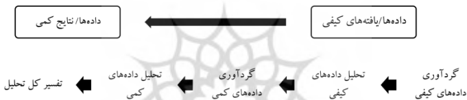
شکل ۱. مدل تصویری طرح شیوه‌های ترکیبی اکتشافی