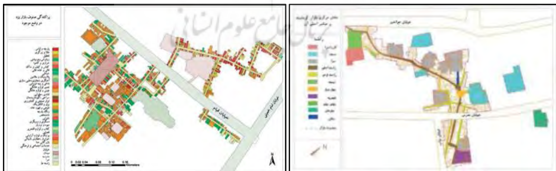
شکل ۲. نقشه کنونی بازارهای کرمانشاه و یزد.

مجموعه بازار سنتی شهر یزد که در جنوب و خارج از دروازه شهر قلعه‌ای قدیم و مرکز شهر سنتی سزد واقع است، امروزه فضای مابین خیابان امام خمینی در شرق، خیابان ملاسماعیل و محله لب خندق در غرب، دیوار تاریخی شهر و محله شاهزاده فاضل و محله دارالشفاء در شمال و محله‌های گودال مصلی و هاشم خان در جنوب را پوشانده است (شکل ۲). این بازار مانند اکثر بازارهای ایرامی در قلب شهر و بدون نقشه قبلی و براساس توسعه شهر شکل گرفته است. شکل بازار یزد، به‌صورت گسترده و نعلی شکل با راسته‌های کوتاه و به هم پیوسته است (سرای، ۱۳۸۹)؛ اما آنچه که امروز به‌عنوان بازار سنتی یزد معرفی می‌گردد کالبدی است مجروح از زمان رضاخان، جراحی حاصل از تقلید نادرست از فرهنگ شهرسازی غرب، بی‌توجه به ساختار شهرسازی ایرانی - اسلامی که در دو خیابان کشی بر چارچوب منسجم بازار یزد تحمیل شده است (آیتی، ۱۳۱۷، ۴۰۲).