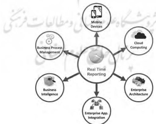
شکل ۲- پاسخ‌های تکنولوژیکی اصلی به چالش حسابداری گزارشگری

شکل ۲ پاسخ‌های تکنولوژیکی اصلی به چالش حسابداری گزارشگری به‌هنگام تعریف شده توسط Belfo و Trigo را نشان می‌دهد که شامل مدیریت فرایند کسب و کار، دستگاه‌های تلفن همراه، رایانش ابری، هوش کسب و کار، معماری سازمانی و یکپارچه‌سازی سیستم‌های سازمان می‌باشد [20].