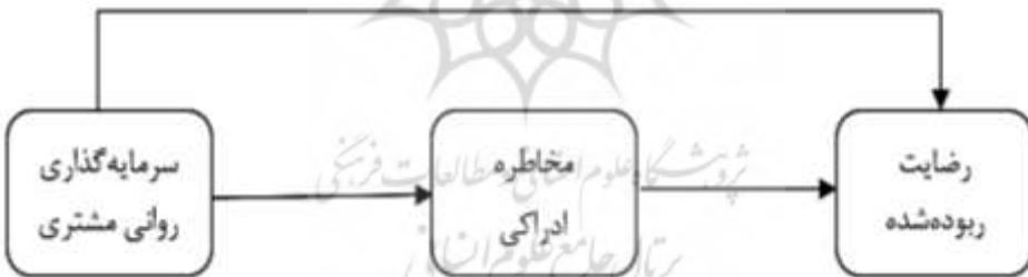
شکل ۱. الگوی پیشنهادی پژوهش حاضر

با توجه به مطالبی که بیان شد؛ هدف این پژوهش تعیین تأثیر سرمایه گذاری روانی مشتری بر رضایت رבוده شده وی بود و البته در این میان مخاطره‌های متصور مشتری، به‌عنوان عامل میانجی در نظر گرفته شد تا از این طریق عوامل بازدارنده در تصمیم‌گیری مشتری را بتوان بهتر شناسایی کرد و نتایج احتمالی این پژوهش را از طریق ارائه راهکارهایی مناسب در اختیار شرکت‌ها و فروشندگان قرار داد تا آن‌ها بتوانند از طریق آن مشتریان خود را بهتر بشناسند و رضایت آن‌ها را تأمین کنند. همانطور که بوگل و همکاران (۲۰۱۰) عنوان کردند؛ شرکت‌ها می‌توانند با بررسی میزان منابع سرمایه گذاری شده از سوی مشتریان به میزان رضایت آن‌ها پی ببرند و با تمرکز بر مشتریانی که میزان سرمایه گذاری‌شان بالا است؛ سعی کنند که مخاطره ادراکی آن‌ها را به حداقل برسانند؛ چرا که مخاطره ادراکی منجر به کاهش تأثیر منابع سرمایه گذاری شده و تردید مصرف‌کننده در تصمیم خرید خود می‌شود. در این پژوهش با بررسی اثر سرمایه گذاری روانی مشتری بر رضایت رבוده شده با میانجیگری مخاطره ادراکی مشتری، الگوی مفهومی پیشنهادی پژوهش و روابط بین این متغیرها در شکل ۱ نشان داده شده است.