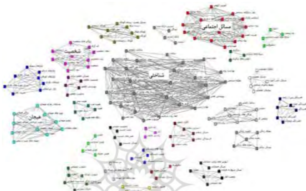
تصویر ۱. نقشه هم‌رخدادی واژگان در مقاله‌های فصلنامه علمی پژوهشی روان‌شناسی کاربردی در حوزه‌های علمی

نت منتقل و به تفکیک سوال‌های پژوهش تحلیل شد. برای پاسخگویی به سؤال اول نقشه هم‌رخدادی واژگان در مقاله‌های فصلنامه روان‌شناسی کاربردی ترسیم و در تصویر ۱ ارائه شد.