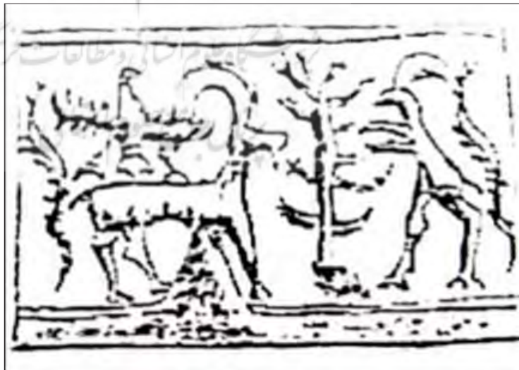
تصویر ۶. طرح مهر استوانه‌ای با نقش درخت و بزهای کوهی، قیر طبیعی، شوش، هزاره سوم ق.م، (Pezard, ۱۹۱۱: ۱۰۰)

بر مهر استوانه‌ای دیگری از شوش که حاوی نقوش ساده‌تری از درخت و بزهای کوهی است، بزهایی ریش‌دار به صورت نمادین و صورت نیم‌رخ در دو سوی درختی مشابه سرو قرار دارند و دو درخت کوچک و کوتاه به صورت قرینه در دو سوی آن قرار دارند. برخلاف نقوش دیگر سر بزها به جهت مخالف درخت برگشته و پاهای جلو، بالا آورده شده‌اند. میان دو بز که تقریباً در مرکز تصویر قرار دارند، خطی مشابه دم بلند یا جزئیاتی احتمالی از درخت ترسیم شده که به دلیل کیفیت پایین به راحتی قابل تشخیص نیست. (تصویر ۵)