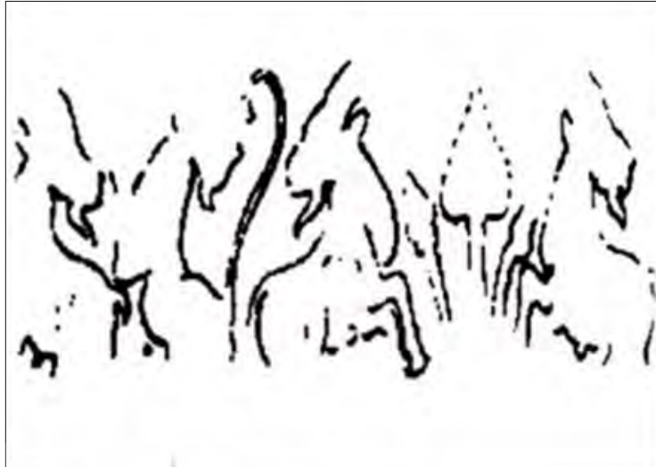
تصویر ۵. طرح مهر استوانه‌ای با نقوش درخت و بزهای کوهی، شوش، ۲۹۵۰ ق.م، موزه لوور- پاریس، (Amiet, ۱۹۷۲: ۱۳۸)

بر مهر استوانه‌ای دیگری از شوش که حاوی نقوش ساده‌تری از درخت و بزهای کوهی است، بزهایی ریش‌دار به صورت نمادین و صورت نیم‌رخ در دو سوی درختی مشابه سرو قرار دارند و دو درخت کوچک و کوتاه به صورت قرینه در دو سوی آن قرار دارند. برخلاف نقوش دیگر سر بزها به جهت مخالف درخت برگشته و پاهای جلو، بالا آورده شده‌اند. میان دو بز که تقریباً در مرکز تصویر قرار دارند، خطی مشابه دم بلند یا جزئیاتی احتمالی از درخت ترسیم شده که به دلیل کیفیت پایین به راحتی قابل تشخیص نیست. (تصویر ۵)