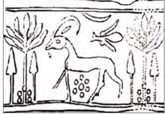
تصویر ۱۹. طرح مهر استوانه‌ای با نقوش درختان و بز، بدل چینی، چغازنبیل، قرن ۱۳ ق.م، ۳۲/۴×۳۲ میلی‌متر، موزه لورر پاریس (پرادا، ۱۳۷۵: ۷۴)

در تصویر ۱۹ نقش هلال ماه در قسمت فوقانی میان دو درخت و نزدیک به شاخ بز دیده می‌شود. بز کوهی با سری نسبتاً بزرگ و شاخ‌های بلند در حالت حرکت مشاهده می‌شود. دو درخت کاملاً قرینه با برگ‌های بزرگ و مشابه که به نظر درخت مقدس یا زندگی هستند، با دو سرو، احتمالاً در نقش نگهبان احاطه شده‌اند. در پای درختان زندگی نقوشی مشابه گل سرخ، آذین گل سرخی یا همان روزت ۳۲ قرار دارند. همین نقش به صورت شش دایره کوچک حول یک دایره مرکزی در قسمت تحتانی فضا در زیر شکم بز تکرار شده است (تصویر ۲۰). اگر تصور ما در این زمینه که این نقش مربوط به خورشید خدای است، صحیح باشد می‌توان تعریف هال را به این تصویر مرتبط دانست که گل سرخ، آذین گل سرخی تجسم چندین خورشید خدای خاورمیانه است و نقش مایه آرایشی مردم پسندی در هنر بین‌النهرین در ادوار بعد بود (هال، ۱۳۹۲: ۳۰۲). پژوهش‌هایی ثابت نموده‌اند که کیش خورشیدپرستی در دوران کهن به‌ویژه در آسیا، اروپا و مصر باستان رایج بوده است. در قسمت فوقانی بدن بز موجودی به شکل پرنده قرار دارد که البته پرادا آن را مگس معرفی کرده است (پرادا، ۱۳۷۵: ۷۴).