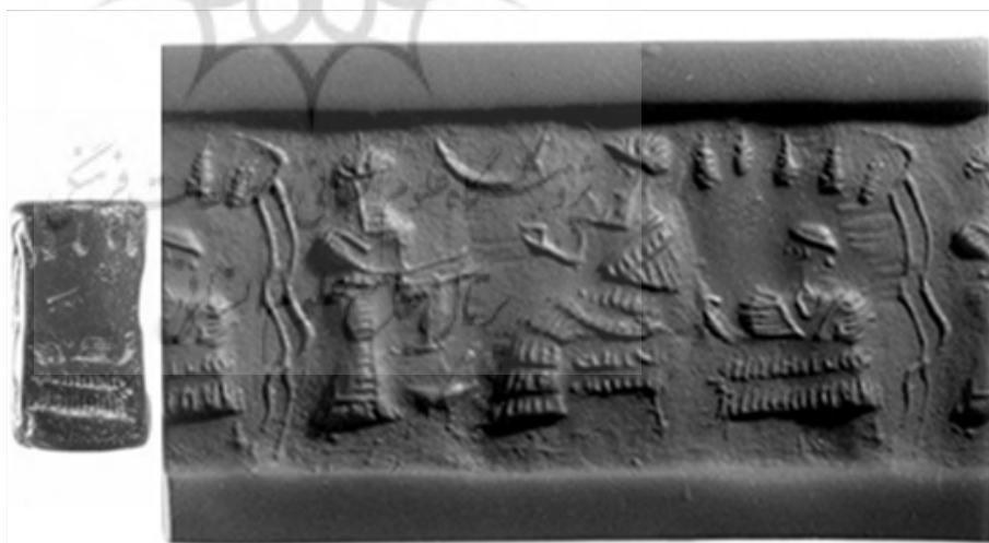
تصویر ۳. مهر استوانه‌ای، ایلام قدیم، ۲۰۰۰ ق.م، ۳×۲ سانتیمتر، موزه متروپولیتن (iranatlas.info)

بر فراز درخت کاج در حال یورش به سمت یکدیگر وجود دارند که یکی از بزها به طور کامل حکاکی نشده است. نقش دو درخت بر مهرهای شوش به روشنی قابل تشخیص است. یکی از آن‌ها درختی در قله کوه است که جانوران شاخ‌دار و بزهای وحشی را روی دو پا در دو طرف به شکل قرینه و در رویارویی نبرد باهم نشان می‌دهد. درخت کاملاً به شکل مخروطیان است و به نظر می‌رسد یا سروی خمره‌ای باشد یا کاج... دیگر نقش گیاهی شامل ردیف درختان کاج است که در طی تاریخ طولانی و جالب خود به صورت یکی از شکل‌های آفتاب درخت تثبیت شده است. گروهی از طرح‌ها و از جمله طرح‌هایی از شوش که در آن‌ها درخت با نمادهای اختری ظاهر می‌شود، مؤید این تعبیر است؛ بنابراین درخت در یک مهر استوانه‌ای ترکیبی است از خراش عمیق خطوطی مستقیم که نشان‌دهنده شاخه‌هاست و ستاره و هلال ماه که به بالای آن متصل است (پوپ، ۱۳۸۷: ۳۶۶). اشکال مشابه صلیب چهارپر احتمالاً به عنوان نمادی از ستارگان به صورت منظم در دو سوی درختان قرار دارند؛ صمدی عقیده دارد که صلیب از قدیمی‌ترین نمادهای ماه محسوب می‌شود (صمدی، ۱۳۸۳: ۲۱). عموماً پس از فرمانروایی خورشید بز کوهی حیوان خورشید نام گرفت و علامتی شبیه به ستاره چند پر که اصطلاحاً "لوتوس" گویند در بین شاخ‌های این حیوان بر سفالینه‌ها رسم شده است (کرتیس، ۱۳۸۷: ۴۵). پیشینه تاریخی و بررسی‌های ژرف در آیین‌های کهن نشان می‌دهد که ستاره‌ی زهره (ناهید) نزد تیره‌های گوناگون مردم جهان مقدس و ستایش می‌شده است. این ستاره در بین‌النهرین زهره و ایشتار... در ایران آن‌هایتا (ناهید) خوانده می‌شد و خداوندگار بود. در ایران هنوز آن‌هایتا نامیده می‌شود و مقدس به شمار می‌آید (بختورتاش، ۱۳۷۱: ۳۲).