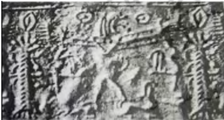
تصویر ۱۸. مهر استوانه‌ای با نقوش موجودات ترکیبی، حیوانات و درخت، بدل چینی، چغازنبیل، ۱۳۰۰ ق.م (عیلام میانی)، ۱۳/۸ × ۴۵/۹ میلی‌متر، موزه لوور پاریس (پرادا، ۱۳۷۵: لوح ۵)

مهر دیگری با فضای دیداری متفاوت و عناصر زیاد به دست آمده که دربردارنده تصاویری از درخت مقدس زندگی، ماه، انسان، حیواناتی چون مار، ببر، شیر، اسب و یک انسان- حیوان با جثه‌ای چندین برابر انسان معمولی است. آمیحه از این قهرمان اساطیری به عنوان "خدای حیوانات" یاد می‌کند، درحالی‌که بیانی معتقد است او گیلگمش است (بیانی، ۱۳۷۵: ۷۵). موجود ترکیبی دیونما با صورت نامشخص ریش‌دار، تن و دست و پای انسانی با جثه‌ای بزرگ در مرکز تصویر به حالت افقی قرار دارد. مار و ببری را در دو دست خود گرفته و به نظر می‌رسد در حال مهار آنان یا زورآزمایی است. در نمادشناسی ایرانی، مار نشانه‌ی رازآلود اهریمن است و اهریمن هرگاه بخواهد به قصد تباهی و زیان کاری ظاهر وارد شود، در صورت ماری ظاهر می‌شود (کزازی، ۱۳۷۲: ۲۸۳). حالت رویارویی و تقابلی موجود ترکیبی یا انسان قهرمان با مارهای دهان‌گشوده در برابر هم، در بسیاری از تمدن‌ها از جمله تمدن جیرفت وجود دارد. در سمت راست دو شیر به دو بز حمله‌ور شده‌اند. موجودی شبیه به الهه با تاجی شاخ‌دار با دسته‌ای رو به بالا در سمت چپ نشسته و در مقابل او یک نقش انسانی نیز با دست‌های رو به بالا در مقابل درختی مشابه سرو قرار دارند (تصویر ۱۷). بیانی درباره موجود الهه‌نما عقیده دارد که او خدای رستنی‌هاست که بر تخت نشسته و خادم به او شاخه‌ای می‌دهد. در پشت خادم درخت مقدس و بز کوهی مظهر روئیدنی‌ها قرار دارند (بیانی، ۱۳۷۵: ۷۵).