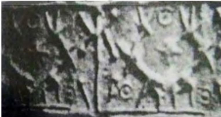
تصویر ۲۱. مهر استوانه‌ای با نقوش درخت و حیوانات، بدل چینی، چغازنبیل، ۱۳۰۰ ق.م، عیلام میانی، ۲۶/۶×۱۳/۸ میلی‌متر، موزه لورر - پاریس (پرادا، ۱۳۷۵: لوح ۵)

در تصویر ۱۹ نقش هلال ماه در قسمت فوقانی میان دو درخت و نزدیک به شاخ بز دیده می‌شود. بز کوهی با سری نسبتاً بزرگ و شاخ‌های بلند در حالت حرکت مشاهده می‌شود. دو درخت کاملاً قرینه با برگ‌های بزرگ و مشابه که به نظر درخت مقدس یا زندگی هستند، با دو سرو، احتمالاً در نقش نگهبان احاطه شده‌اند. در پای درختان زندگی نقوشی مشابه گل سرخ، آذین گل سرخی یا همان روزت ۳۲ قرار دارند. همین نقش به صورت شش دایره کوچک حول یک دایره مرکزی در قسمت تحتانی فضا در زیر شکم بز تکرار شده است (تصویر ۲۰). اگر تصور ما در این زمینه که این نقش مربوط به خورشید خدای است، صحیح باشد می‌توان تعریف هال را به این تصویر مرتبط دانست که گل سرخ، آذین گل سرخی تجسم چندین خورشید خدای خاورمیانه است و نقش مایه آرایشی مردم پسندی در هنر بین‌النهرین در ادوار بعد بود (هال، ۱۳۹۲: ۳۰۲). پژوهش‌هایی ثابت نموده‌اند که کیش خورشیدپرستی در دوران کهن به‌ویژه در آسیا، اروپا و مصر باستان رایج بوده است. در قسمت فوقانی بدن بز موجودی به شکل پرنده قرار دارد که البته پرادا آن را مگس معرفی کرده است (پرادا، ۱۳۷۵: ۷۴).