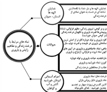
نمودار ۲. درخت زندگی و عناصر مرتبط با مفاهیم باروری در عیلام (نگارنده)