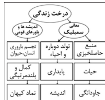
نمودار ۱. معانی نمادین و باورهای قومی درباره درخت زندگی (نگارنده)

در تصویر ۲ بر مهر استوانه‌ای، نقوش بزهایی با شاخ‌های فراخ مشابه هلال ماه و درختانی بر تپه‌ها یا کوه‌های انباشته مشاهده می‌شود. در اعتقادات ایرانیان باستان کوه جایگاه ویژه‌ای داشته‌است و در بندهشن بخش دوازدهم ذکر شده که نخستین کوهی که فراز رست البرز ایزدی بود. بزهای ری‌شدار در دو سوی درختان دو پای جلویی را بر روی کوه یا تپه قرار داده و به نظر می‌رسد در مقام نگهبانان، وظیفه حفاظت و حراست از درخت مقدس را بر عهده دارند. بز کوهی با شاخ‌های بزرگ‌تر از حد معمول و درست شبیه به هلال ماه بر سفالینه‌ها ترسیم شده است گاه فقط شاخ او نماد ماده است (صمدی، ۱۳۸۳: ۲۱). نقوش دیگری از دو بز کوچک