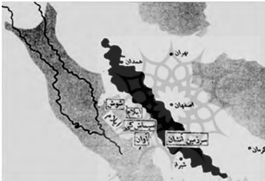
نقشه ۱. ایالت‌های عیلام، طبق نظر آمیه، (والا، ۱۳۷۳)

دین عیلامی نیز به گونه‌ای پایدار، فردیت و خصوصیات خاص خود را دارا بود. شوش، دوراوتناش ۸ (چغازنبیل) ۹ ، ملیان ۱۰ ، سیماش ۱۱ و اوان ۱۲ از بااهمیت‌ترین شهرهای عیلام بوده‌اند. (نقشه ۱). شوش قدیمی‌ترین پایتخت اصلی، سیاسی و دینی جهان بوده و بسیاری از مهرهای عیلام متعلق به این مکان هستند. در برخی تقسیم‌بندی‌ها، عیلام شامل سه دوره تاریخی می‌شود: عیلام قدیم ۱۳ (عیلام باستان)، حدود ۲۷۰۰ تا ۱۶۰۰ ق.م - عیلام میانه ۱۴ (دوره طلایی)، حدود ۱۵۰۰ تا ۱۱۰۰ ق.م - عیلام نو ۱۵ ، حدود ۱۱۰۰ تا ۵۳۹ پ.م، اما اوج شکوفایی در نیمه دوم هزاره دوم پیش از میلاد بوده است. در دوران پادشاهی آشور بانسی پال ۱۶ این تمدن از بین رفت و با از میان رفتن ساختار سیاسی، سلطه بر مردم این سرزمین در دوران امپراتوری هخامنشی ۱۷ ادامه یافت.