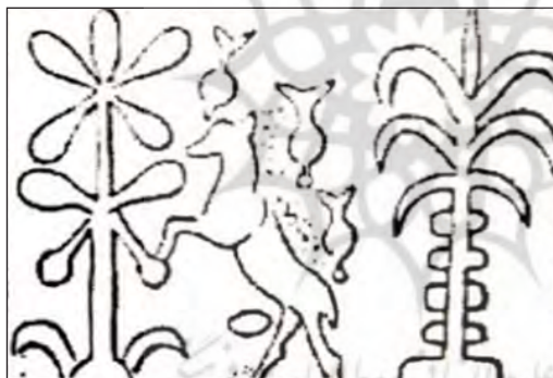
تصویر ۲۴. طرح مهر استوانه‌ای با نقوش درخت و حیوان، بدل چینی، چغازنبیل (عیلام میانی)، ۱۶×۴۴ میلی‌متر، موزه تهران (پرادا، ۱۳۷۵: ۷۳)

تکراری و نمادین به کاررفته بر مهرهای عیلام است. ماهی نماد حاصل خیزی و باروری بود. و حتی در آیین‌های کهن نماد ثروت و فراوانی، ازدواج و باروری بوده است. هال می‌نویسد: آ ۳۴ خدای سومری آب تازه، دارای شکل ماهی یا بزی با دم ماهی (اصل و منشأ برج جدی) است. کاهنانش در دوره نوآشوری، جامه‌ای به صورت ماهی به تن داشتند (هال، ۱۳۹۲: ۱۰۰). یک ستاره شش‌پر در سمت راست و ستاره‌ای دیگر در سمت چپ قرار دارد. به نظر پرادا در اینجا بزهای کوهی به حالت ایستاده در کنار یک درخت طراحی شده‌اند، ولی به نظر می‌رسد که وضعیت عمودی آن‌ها مورد تهدید است. این حیوانات شاخ‌دار روی دو پای عقب خود ایستاده‌اند، نه تنها برای این که برگ‌های یک درخت را بچرند، بلکه خود را در حالت یک نبرد قرار دهند. به نظر این امکان وجود دارد که تعبیر حالت این حیوانات به مثابه یک رفتار جنگی صحیح باشد. با این حال باید گفت که فقط شکار چیان کوهستان‌ها می‌توانسته‌اند شاهد جنگ بزهای کوهی برپایستاده باشند. اگر این بن‌مایه جزو سیاهه‌های چغازنبیل است، باید برای عیلامی‌ها دارای نشان و معنای خاصی باشد. شخصیت ترسیم‌شده احتمالاً یک ستایشگر است و همین امر در حکاکی آشوری به فعالیت شکارگری یا جنگ‌جویی مربوط می‌شود. با این همه، ما قبلاً نقش یک ستایشگر را با پیراهنی کاملاً کوتاه در مهرهای استوانه‌ای عیلامی یافته‌ایم (پرادا، ۱۳۷۵: ۶۸).