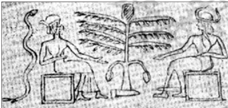
تصویر ۸. طرح آدم و حوا در میان درخت خرما (fao.org/docrep)

دو سوی درخت زندگی در بسیاری از تمدن‌ها، همچون تمدن جیرفت، به‌عنوان نگهبان و محافظ نقش شده است. بز سمت راست، دو پای جلویی خود را بر روی درخت قرار داده و به‌صورت نمادین در حال تغذیه از درخت و بز دیگر با جثه‌ای بزرگ‌تر به حالت معمولی ایستاده‌است. البته پزارد عقیده دارد در این صحنه درخت زندگی در میان دو گوزن نمایش داده شده که مشغول خوردن جوانه‌های تازه و پامیوه‌های درخت هستند (Pezard، ۱۹۱۱: ۱۰۰). دلیل احتمالی تصور نقش گوزن شاید حالت و فرم درشت بدن حیوان سمت چپ و فرم شاخ‌ها باشد. توسکان این دو حیوان را بز کوهی قلمداد کرده‌است (Toscane، ۱۹۱۱: ۱۷۱). در سمت راست حیوانی به‌صورت عمودی حک شده که توسکان آن را هزارپا (همان: ۱۷۱) و پزارد مار معرفی می‌نماید (Pezard، ۱۹۱۱: ۱۰۰). ارتفاع درخت زندگی تقریباً برابر با بزهاست و نقشی مشابه با درخت مقدس در دیگر آثار دارد. بر فراز سر بز یا گوزن بزرگ‌تر نقش عقاب یا شاهینی با بال‌های گشوده قرار دارد، عقاب نیز مانند بز از نگهبانان درخت زندگی به‌شمار می‌رود. بیانی درباره نماد شاهین در عیلام می‌نویسد: شاهین پرنده‌ای قوی و بلندپرواز است و به اعتقاد انسان‌های اولیه پرنده آسمانی است که زمین و موجودات را حمایت می‌کند، این پرنده در عیلام جزو مظاهر این شوشیناک خدای حامی شوش درآمد و خدای حامی نه‌تنها انسان‌ها را موردنظر داشت، بلکه حیوانات وحشی و اهلی را در پناه قدرت خویش نگهبانی می‌کرد (بیانی، ۱۳۷۵: ۱۹).