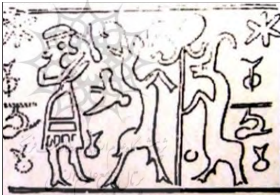
تصویر ۲۳. طرح مهر استوانه‌ای با نقوش درخت و بزهای کوهی، بدل چینی، چغازنبیل، قرن ۱۳ ق.م، ۴۷ × ۱۶/۲ میلی‌متر، موزه تهران، (پرادا، ۱۳۷۵: ۷۳)

برگردانده به عقب و شاخ‌هایی فراخ در سمت راست و بالای تصویر انسان مشاهده می‌شود. این حیوان (گوزن) برای اقوام هندواروپایی آسیای مرکزی مقدس بوده و غالباً در هنر آنان نشان داده می‌شد (هال، ۱۳۹۲: ۹۱). گوزن نیز مشابه بز و گاو نماد خورشید و باروری است. افضل طوسی عقیده دارد: گوزن نماد نیک‌خواهی، مرتبط با شرق، طلوع و روشنایی و پاکی، باززایی و احیاء، خلاقیت و الهام است (افضل طوسی، ۱۳۹۳: ۶۷). نقش دایره‌ای شبیه ستاره در سمت راست قرار دارد. در تفکرات مردم ابتدایی ضبط و ربط برخی امور در طبیعت به اجرام آسمانی و کیهانی بستگی داشته‌است. به نظر می‌رسد به دلیل تکرار گسترده ستاره نیز از اجرامی بود که به‌طور ستایش‌انگیزی در تمدن عیلام قابل توجه بوده و به اعتقادات مذهبی جامعه مرتبط بوده است. درخت نقش‌شده در این اثر مشابه درخت منقوش بر روی پلاک عاج یافت‌شده از چغازنبیل است. از طرفی ظرافت‌های بز کوهی این مهر استوانه‌ای و پرندگان نزدیک به نوک درخت یادآور مهرهای استوانه‌ای زیبایی کاسیت می‌باشد (پرادا، ۱۳۷۵: ۶۷).