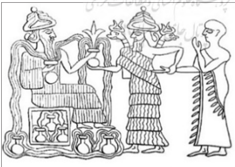
تصویر ۱۵. طرح معرفی گودئا شاهزاده لاگاش در سومر، به وسیله خدای نگهبان، نین‌گیش‌زیدا به انکی، ۲۵۰۰ ق.م (به لک، ۱۳۸۴: ۲۳)