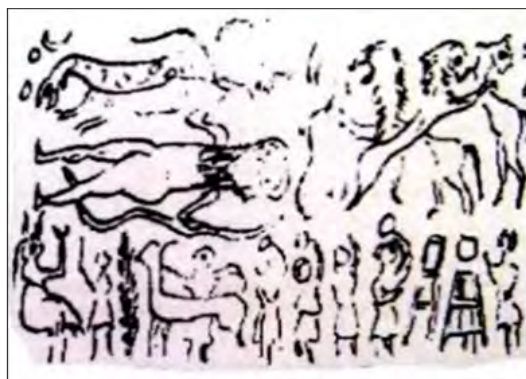
تصویر ۱۷. طرح مهر استوانه‌ای با نقش انسان قهرمان، سنگ آهک، شوش، اوایل هزاره دوم ق.م، ۰/۰۴۱×۰/۰۲۲ سانتیمتر، موزه ایران باستان تهران، (بیانی، ۱۳۷۵: ۷۶)

بر مهر گلی از شوش در تصویر ۱۶، مشابه نمونه تصویری ۱۴ نقش مار-خدایی نیم‌رخ با سر و نیم‌تنه انسان و شاخ تاج‌دار مشاهده می‌شود. او نیز شاخه‌ای مقدس در دست چپ و بر روی جام آتشین پایه‌دار نگه داشته است. بیانی عقیده دار شاخه درخت مظهر رویدنی‌ها و نمونه‌ای دیگر از تجلی درخت مظهر زندگی است (بیانی، ۱۳۷۵: ۲۲). به نظر می‌رسد دست راست مارخدا زیر لباس نیم‌تنه‌ای که پوشیده پنهان شده است. در بالای آتشدان و شاخه درخت، هلال ماه، سمبل الهه ناپیر ۳۱ نقش شده است. شاخه گیاه به‌عنوان نمادی از درخت زندگی یا متعلق به آن، احتمالاً به‌عنوان پیشکش به آتش مقدس در مراسمی آئینی، مذهبی یا گیاهی خوشبو جهت معطر کردن عبادتگاه به‌کار می‌رفته است. الیاده معتقد است: در این زمان چیزهایی که به آتش اهدا می‌شد مخلوطی از سه چیز بوده است: چوب خشک، گیاه خوشبو، حیوان فربه (Eliade، ۱۹۸۷: ۲۷۷).