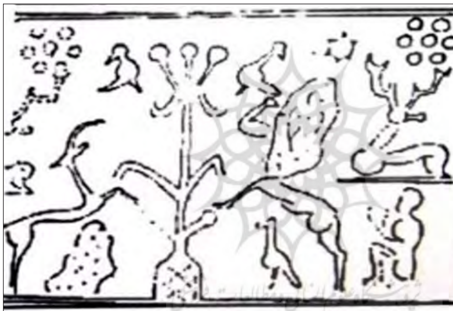
تصویر ۲۲. طرح مهر استوانه‌ای با نقوش درخت و حیوانات شاخدار، بدل چینی، جغازنبیل، عیلام میانی ۴۶/۶×۱۴/۳ میلی‌متر، موزه ایران باستان (پرادا، ۱۳۷۵: ۷۱)

دو جانور شاخدار مشابه بز کوهی تصویر ۲۱ مانند نقوش دیگر، پاهای جلویی خود را بر روی درخت احتمالاً زندگی قرار داده‌اند. پرادا این دو جانور را آنتیلوپ ۳۳ نام نهاد (پرادا، ۱۳۷۵: ۷۲). در قسمت تحتانی و فوقانی سر بزها دایره‌های متحدالمرکز رسم شده‌اند. در مرکز درختی قرار دارد با تنه بسیار باریک و دو شاخه به شکل جناقی متقارن با پنج ساقه در رأس که دایره‌هایی در انتهای هر ساقه وجود دارد که ممکن است نشانه گل‌ها و یا میوه‌های درخت زندگی باشند. دایره نمادی از حرکت پیوسته و مدور آسمان بوده و با الوهیت نیز در ارتباط است... دایره در معنایی مستقیم‌تر نشان‌دهنده‌ی آسمان کیهانی است (دادور؛ منصوری، ۱۳۹۰: ۲۲۸). تصویر ستاره‌ای پنج پر نزدیک بدن بزها به چشم می‌آید که در اعتقادات مردم باستان نماد ستاره‌ها مربوط به خدایان نرینه و مادینه هستند.