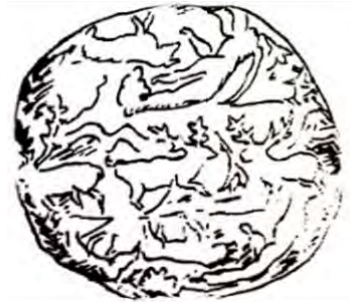
تصویر ۱۱. طرح مهر استوانه‌ای با نقوش درخت زندگی و گوزن‌ها، گل خام، شوش، هزاره سوم ق.م، موزه لوور، پاریس (بیانی، ۱۳۷۵:۳۱)

در تصویر ۱۲، پادشاه یا خدای عیلامی تقریباً در فضای مرکز تصویر بر روی چهارپایه‌ای نشسته و روبه‌روی او شخصیتی مانند ملازم به حالت احترام ایستاده که دست‌های خود را بر روی سینه قرار داده است. در پشت سر ملازم و پادشاه یا خدا، درختانی تزئینی با فرم‌های جالب توجه و ریشه‌های بیرون آمده با حالتی مشابه نگهبانان ایستاده قرار دارند. به نظر می‌رسد درختان با پرداختی از این نوع، درختان مقدس زندگی و دارای ارزش‌های آئینی باشند. این درخت، درخت عجیبی است که روی پشته‌ای می‌روید، اما نباید نمایش ساختمان شیئی چلچراغ مانند را نادیده گرفت (پرادا، ۱۳۸۶:۵۰). با توجه به وضعیت پادشاه یا خدا با جامی در دست راست، نماد ماه در بالا، درختان و نیز پرنده‌ای در روبه‌رو به نظر می‌رسد مراسم آیینی در شرف انجام است. در این صحنه جام آب و درخت مشابه زندگی و حاصلخیزی است (بیانی، ۱۳۷۵:۸۱).