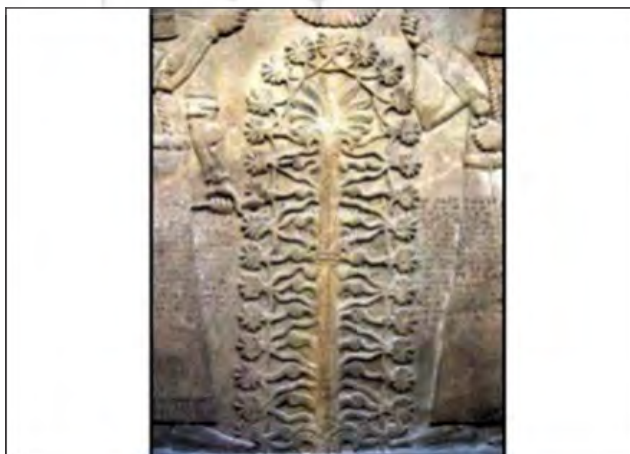
تصویر ۱. نقش درخت زندگی، نخل، ۸۶۰ تا ۸۶۵ ق.م. (Wilson, ۱۹۹۴)