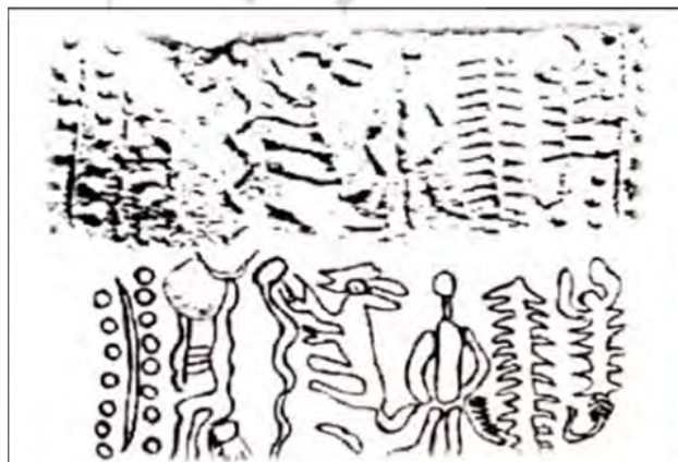
تصویر ۱۰. نقش و طرح مهر استوانه‌ای با نقش درخت، گچ، شوش، هزاره سوم ق.م، ۲۷×۴۳ سانتیمتر، موزه لوور پاریس (Delaport، ۱۹۲۰: ۲۹)

در اسطوره‌های سومری، تصویر "مهر و سوسه" که نماد ایزدبانوی سومری‌ها به نام گالابانو (مظهر بزرگ مادر زمین) است، در سمت چپ درخت دیده می‌شود. در پشت او، مار قرار گرفته که نماد نیروهای وجود است. در سمت دیگر، پسر معشوق این ایزد بانو، دوموزی، خدای همیشه میرا و همیشه زنده شده نباتات، دیده می‌شود. او پسر ایزد، خدای درخت زندگی است (کوک، ۱۳۸۷: ۱۵۹). مار از رایج‌ترین تصاویر مثالی، سرچشمه حیات و تخیل است و غالباً پیچیده به دور درخت تصویر می‌شود و همانند درخت تقریباً در همه تمدن‌ها، موجب پیدایش انبوهی از اسطوره‌های تلفیقی شده است (دوبوکور، ۱۳۸۷: ۴۱). در تصویر مشابه دیگر، تصویر ۹ مکشوفه از چغازنبیل شخصیتی بااهمیت روبه‌روی درخت زندگی ایستاده و بازنمایی فضای معماری گونه اطراف او جالب توجه است.