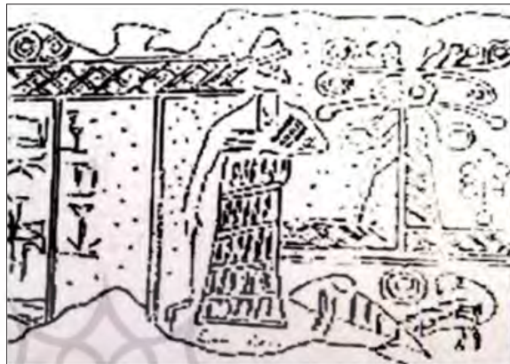
تصویر ۹. مهر استوانه‌ای، با نقش درخت، چغازنبیل (پرادا، ۱۳۷۵: ۳۸)

نمی‌تواند جنبه صرفاً تزئینی داشته باشد. از مهم‌ترین مفاهیم مار تجدید حیات بوده و در کتاب مقدس آمده که ارتباط میان زن، مار و درخت وجود دارد. در محافل ربن‌های یهود مشهور است که بی‌نمازی زنان حاصل مناسبات جنسی میان حوا با مار در بهشت است (الیاده، ۱۳۸۹: ۱۷۰). بهشت سومری دیلمون ۳۳ نام داشت و بر اساس داستان مشابه دیگر. (تصویر ۸)