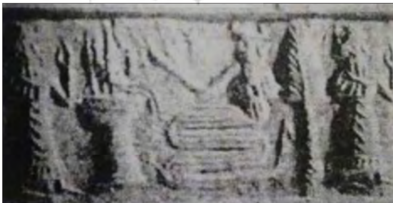
تصویر ۱۴. مهر استوانه‌ای با نقش مار - خدا و درخت سرو، گل، شوش، ۲۳۰۰ ق.م، ۱۷/۰ × ۳۰/۰ میلی‌متر، موزه لوور پاریس (بیانی، ۱۳۷۵: ۶)

تصویر ۱۳ کاملاً مشابه تصویر ۱۲ است، پادشاه یا خدا بر تختی نشسته و با دست چپ خود احتمالاً شاخه‌ای از درخت مقدس و در دست راست شیئی نعلی شکل به طرف جلو دراز کرده و در مقابل وی ملازمی به حالت احترام ایستاده است. درختان نخل با تنه‌های قطور سوزنی در دو سوی تصویر به چشم می‌آیند. پرنده‌ای روبه‌روی پادشاه و ملازم قرار دارد. پرادا می‌نویسد از ویژگی‌های خاص مهرهای شوش یک درخت در انتهای یک صحنه یا نهادن یک میز حامل پرنده است (پرادا، ۱۳۸۶: ۴۹). نقوش هلال ماه و ستاره در بالای تصویر میان خدا و ملازم قرار دارد که وجود اجرام سماوی و نمادهای باروری، یقیناً نمایشی از مراسمی آیینی باروری در نزد عیلامیان باشد. به نظر بیانی عیلامی‌ها خدای ماه را "سین" می‌نامیدند... مظهر سین هلال ماه بود و تعداد زیادی مهرهای استوانه‌ای شکل مکشوفه از شوش (اواخر هزاره سوم و اوایل هزاره دوم ق.م)، نقش خدای سین که مورد احترام و پرستش اهالی آن سامان بوده است، به صورت هلال ماه، درزمینه مهرها یا در بالای سر خدایان ایستاده یا نشسته بر تخت نشان می‌دهد (بیانی، ۱۳۷۵: ۸۲).