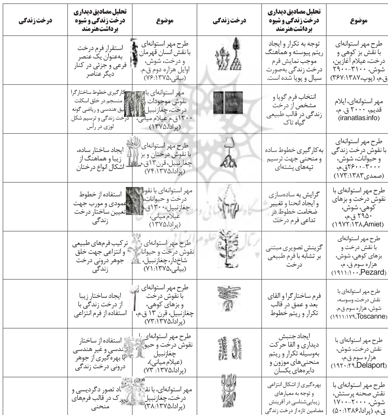
جدول ۱: تحلیل مصادیق دیداری درخت زندگی در عیلام (نگارنده)

آن‌ها صورت گرفته است. ویژگی‌هایی چون گرایش به ساده‌سازی، خلق اسکلت دقیق، هندسی و ریاضی‌گونه درخت زندگی در برخی مهرها، موجب نمایش استقرار این نقش به‌عنوان یک عنصر اصلی یا فرعی و جزیی در کنار دیگر عناصر شده که شرح آن‌ها در جدول ۱ مشاهده قابل مشاهده است.