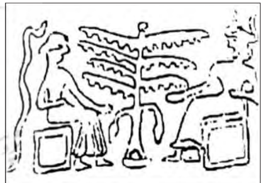
تصویر ۷. طرح مهر استوانه‌ای با نقش درخت، وسوسه، شوش، هزاره سوم ق.م. (Toscane، ۱۹۱۱: ۱۷۹)

بر مهر استوانه‌ای تصویر ۷ که توسکان عقیده دارد که این مهر استوانه اسمیت، از شوش به‌دست آمده (Toscane، ۱۹۱۱: ۱۷۹) خدای شخصیت‌یافته در قالب انسانی و پادشاهی با تاج شاخ‌دار و لباسی بلند در سمت راست نشسته است و در سمت چپ انسانی دیگر دیده می‌شود که لباس دامن‌داری پوشیده است و بر روی تختی مکعب شکل نشسته است. درختی مشابه درخت نخل یا خرما با شاخه‌های دندان‌های شکل تقریباً قرینه در مرکز قرار دارد. در بین‌النهرین درخت نخل گیاهی بود که در مراسم باروری استفاده می‌شد. بر فراز درخت مقدس، به‌عنوان نماد باروری، تاجی از نقش مایه نخل [نواشوری، سده هفتم پیش از میلاد]، به‌ویژه بر روی یادمان‌هایی از سده دهم پیش از میلاد قرار دارد (هال، ۳۰۶۱۳۹۲). هر دو شخصیت یکی از دستان را به‌سوی درخت دراز کرده‌اند که ممکن است نمادی از انجام عملی مذهبی باشد. وجود ماری در پشت زن، داستان وسوسه آدم و حوا توسط مار و چیدن میوه الهی را به یاد می‌آورد؛ البته مهر وسوسه نامی است که برخی بر این مهر نهاده‌اند. بر اساس قرائن موجود نقش مار به‌هیچ‌عنوان