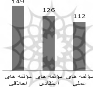
نمودار ۲: مؤلفه‌های اخلاقی، اعتقادی و عملی یهود

مؤلفه‌های معنایی بیانگر سرانجام قوم یهود به ترتیب فراوانی و اولویت عبارت‌اند از: عذاب جهنم (۱۴)، خشم الهی (۱۰)، بیماری قلب (۶)، هلاکت و نابودی در دنیا (۳) و خسران در آخرت (۳). افزون بر این، لعن و نفرین الهی (۱۶) و خواری و حقارت (۱۰) نیز مواردی است که در دنیا و آخرت هر دو به آن دچار خواهند شد.