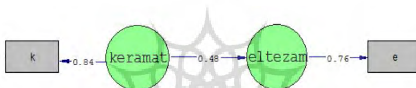
شکل 1: ضرایب مسیر متغیرها (ضریب بی) مدل سؤال اصلی پژوهش

در پژوهش حاضر، از مدل‌سازی معادلات ساختاری با رویکرد حداقل مربعات ساختاری به کمک نرم‌افزار اسمارت پی.ال.اس استفاده شده است. شکل 1 و 2، خروجی نرم‌افزار را در خصوص مدل مفهومی پژوهش نشان می‌دهند.