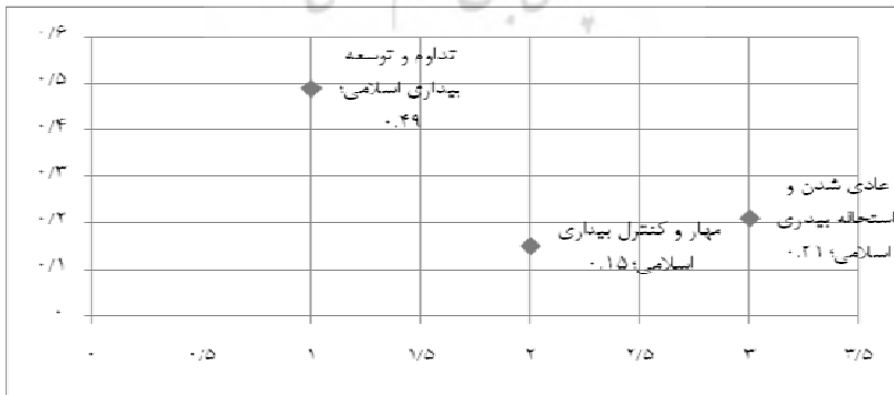
نمودار ۲. ترتیب وقوع سناریوهای متحمل در آینده اسلام سیاسی مصر

بنابراین در پاسخ به سؤال «روند تحولات اسلام سیاسی در کشور مصر، چگونه پیش‌بینی می‌شود؟»، ضمن تأیید فرضیه فرعی مبنی بر «آینده اسلام سیاسی در مصر در قالب سه سناریو شامل: ۱. عادی شدن و استحاله بیداری اسلامی، ۲. مهار و کنترل بیداری اسلامی، ۳. تداوم و توسعه بیداری اسلامی شکل خواهد گرفت» پیش‌بینی می‌شود روند تحولات اسلام سیاسی در کشور مصر با تداوم و توسعه بیداری اسلامی همراه باشد.