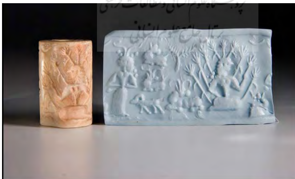
تصویر ۴. مهر استوانه‌ای به دست آمده از گور ۱۶۳ گورستان شهداد.