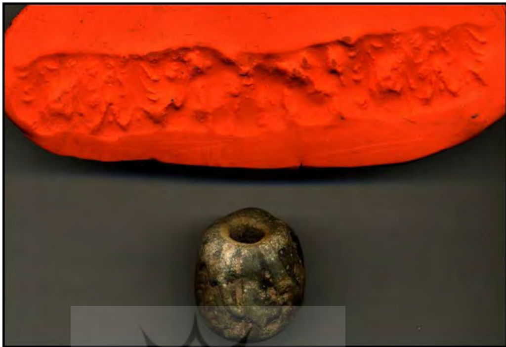
تصویر ۵. مَهر استوانه‌ای منتشر نشده به دست آمده از کارگاه D، اتاق شماره ۲ (آرشیو موزه ملی).