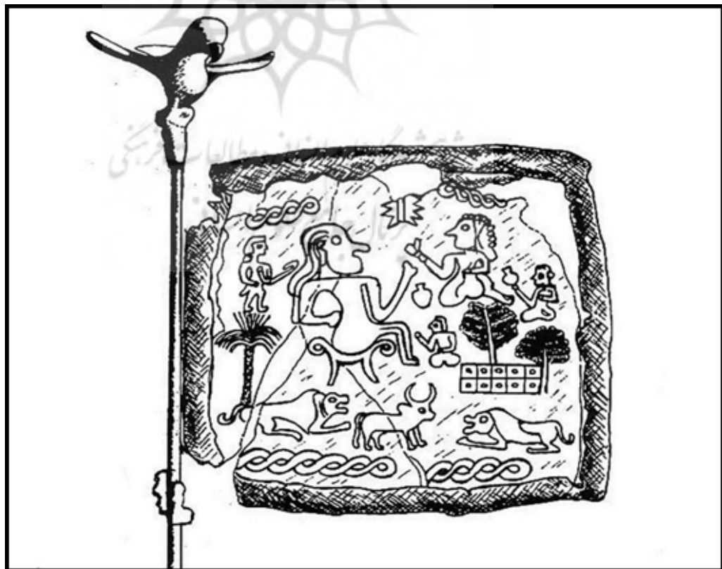
تصویر ۱. طرح حک شده بر روی صحنه استاندارد شه‌داد (Hakemi, 1997: 649).