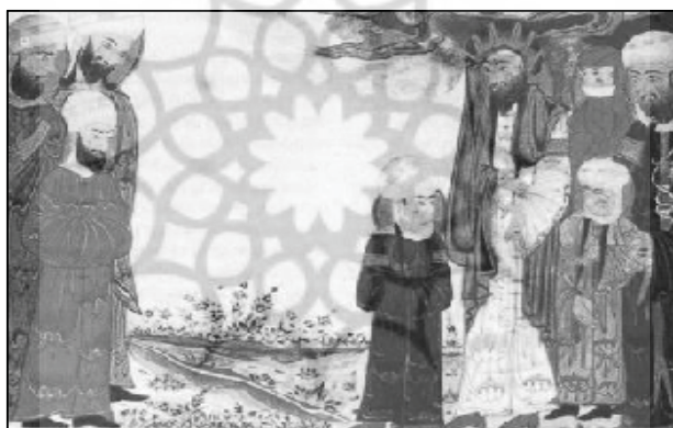
شکل (۴): نمایندگان مسیحیان نجران و آل عبا، آثار الباقیه بیرونی، حدود ۷۰۷ ق، نسخه متأخر بر پایه نسخه ادینبورگ، کتابخانه ملی پاریس ۳

خداوند است. بنابراین دعا یا نفرین ایشان نیز در روز مباحله به اذن خداوند مستجاب می‌شد. در کنار حضرت فاطمه علیها السلام ، حضرت علی علیه السلام در سمت راست تصویر ایستاده است. با استناد به آیه مباحله، واژه «انفسنا» در این آیه، به حضرت علی علیه السلام اشاره دارد و منظور از «نفس» این است که علی علیه السلام مثل و مانند پیامبر صلی الله علیه و آله است. ۱ همین‌طور بر طبق آیه «أَفَمَنْ يَهْدِي إِلَى الْحَقِّ أَحَقُّ أَنْ يُتَّبَعَ أَمَّنْ لَا يَهْدِي إِلَّا أَنْ يُهْدَىٰ فَمَا لَكُمْ كَيْفَ تَحْكُمُونَ» ۲ از انطباق جمله «انفسنا» به «علی علیه السلام » می‌توان پلی به سوی ولایت و امامت زد و در موضوع این نگاره، ولایت به حق حضرت علی علیه السلام را هم ثابت کرد. در دو طرف پیامبر صلی الله علیه و آله نیز حسنین علیهما السلام مصور شده‌اند تا بزرگی و منزلت آل عبا در درگاه خداوند تأکید شود. بنابراین، پیامبر صلی الله علیه و آله در این نگاره به همراه خانواده خود نقاشی شده و از دیگر نزدیکان پیامبر صلی الله علیه و آله کسی حاضر نیست. نگارگر با این کار علاوه بر نمایش واقعه مباحله، باورها و اعتقادات شیعه را براساس مدارک مستند با مضامین مذهبی در نسخه نفیسی چون آثار الباقیه رقم زده و مانوس بودن پیامبر صلی الله علیه و آله با آل عبا و برحق بودن علی علیه السلام را بیان کرده است. درحقیقت نگارگران، رویداد تاریخی و مذهبی‌ای را به تصویر کشیده‌اند که از وجه سیاسی و اجتماعی نیز برخوردار است. در اینجا نگارگر به اصل واقعه وفادار بوده و جریان مباحله را با توجه به متن کتاب به شیوه‌ای بیان کرده که در راستای مشروعیت دینی و مذهبی حکام ایلخانی و پیشبرد اهداف آنها باشد.