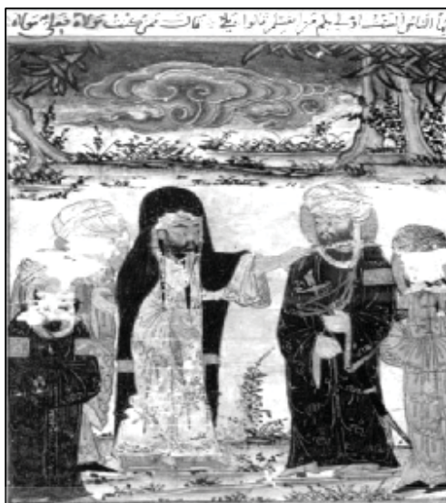
شکل (۵): پیامبر ﷺ علی را جانشین خود اعلام می‌کند، آثارالباقیه بیرونی، نسخه متأخر بر اساس نسخه ادینبورگ، کتابخانه ملی پاریس ۱

مقبولیت و مشروعیت حکام، از طریق تهیه نسخ خطی در تعداد زیاد و توزیع آن در میان دوستان و دانشمندان و حکام سرزمین‌های دیگر میسر بود.