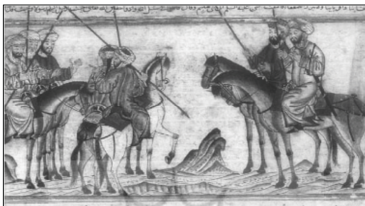
شکل (۱): پیامبر صلی الله علیه و آله و حضرت علی علیه السلام و حمزه را به مأموریت در جنگ بدر می‌فرستد

همچنین، آشنایی با حضرت علی علیه السلام و فداکاری‌ها و رشادت‌های ایشان به‌عنوان شخصیت دوم اسلام بعد از پیامبر صلی الله علیه و آله ، راه را برای گرایش حکام ایلخانی به تشیع باز کرد. به‌نظر می‌رسد یکی از دلایل توجه نگارگران به رشادت‌ها، دلاوری‌ها و جنگاوری‌های حضرت علی علیه السلام مثلاً در جامع‌التواریخ رشیدی - و حمایت حکام ایلخانی از این نگارگری‌ها آن بود که حکام از تأثیر این نگاره‌ها بر مقبولیت و مشروعیت حکومت خود آگاهی داشتند. در شکل‌های ۱ و ۲ ضمن اینکه به نقش حضرت علی علیه السلام در جهادهای صدراسلام تأکید شده، جهاد سیاسی و دینی مسلمانان با کفار تصویر شده است.