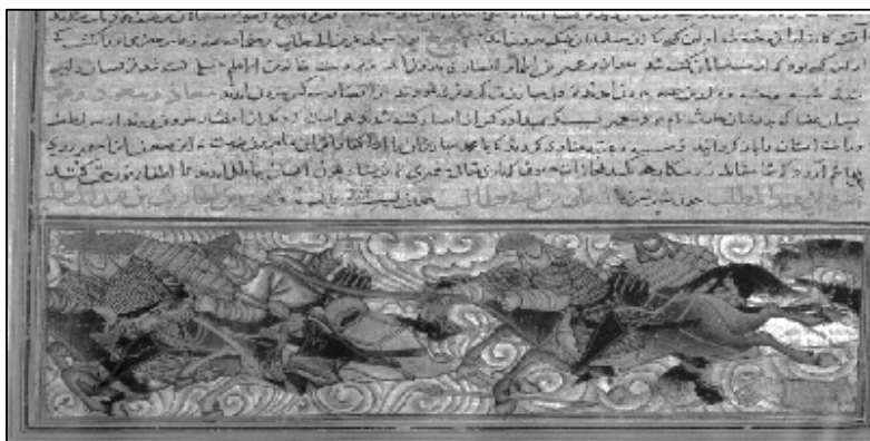
شکل (۲): جنگ بدر، جامع‌التواریخ رشیدی، ۷۱۴ هجری، موزه کتابخانه توبقایی استانبول ۱