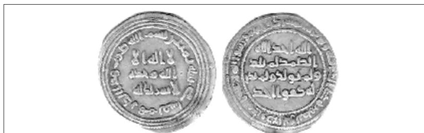
شکل (۷): درهم اسلامی خالص

مرحله سوم: این مرحله که آخرین مرحله تعریب و اصلاح درهم است تقریباً از سال ۷۸ ق / ۶۹۸ م آغاز گردید. در این مرحله درهم بر طراز خالص عربی - اسلامی ضرب شد. بر روی این درهم تنها نوشته‌ها و عبارت‌های اسلامی و به خط کوفی نوشته شده بود. ۱ (شکل ۷)