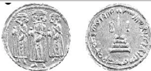
شکل (۲ - ب): دینار اسلامی متأثر از بیزانس

قسمت روی سکه: فقط صلیب روی عصاها به اشکال کروی تغییر داده شد. قسمت پشت سکه: صلیب «T» شکل موجود در مرکز دینار، به کره تغییر داده شد. در اینجا عبارت دعایی یونانی حذف و به جای آن دور تا دور سکه عبارت «بِسْمِ اللَّهِ لَا إِلَهَ إِلَّا اللَّهُ وَحْدَهُ مُحَمَّدٌ رَسُولُ اللَّهِ» نوشته شد. (تغییرات موجود در این سکه بخش دوم مرحله اول تغییر سکه در عهد عبدالملک بن مروان محسوب می‌گردد)