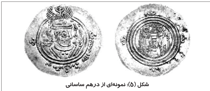
شکل (۵): نمونه‌ای از درهم ساسانی

مرحله اول: در این مرحله درهم بر طراز ساسانی و منقش به تصویر کسری ضرب می‌شد. (شکل ۵) دورتادور آن نیز با خط کوفی، عبارت «بِسْمِ اللَّهِ لَا إِلَهَ إِلَّا اللَّهُ وَحْدَهُ مُحَمَّدٌ رَسُولُ اللَّهِ» نوشته شده بود. مکان و تاریخ ضرب که شهر دمشق و سال‌های ۷۳ ق / ۶۹۳ م و ۷۴ ق / ۶۹۴ م بود، نیز بر آن وجود داشت. ۱ این درهم‌ها در مناطقی که قبلاً تحت نفوذ ساسانیان بودند استفاده می‌شدند.