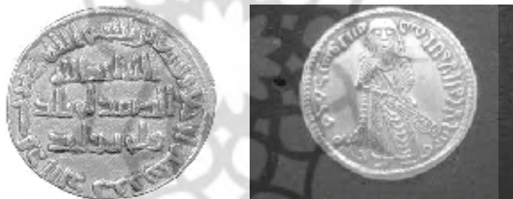
شکل (۳): دینار با تصویری شبیه عبدالملک بن مروان

۲ - مرحله دوم (سالهای ۷۷ - ۷۴ هجری): در این مرحله تصویر امپراتور حذف و به جای آن خلیفه مسلمانان یعنی عبدالملک بن مروان و نوشته‌ای با خط کوفی درج گردید و پشت سکه نیز سال ضرب سکه به عربی نوشته شد. (شکل ۳) این اقدام، گامی حساس در جهت تعریب و اصلاح دینار بود؛ چون درحقیقت انقلاب بزرگی علیه مسکوکات قبلی به شمار می‌رفت. ۲ برخی از نویسندگان معاصر براساس تصویر عبدالملک، بر این سکه نام «خلیفه ایستاده» اطلاق کرده‌اند. ۳