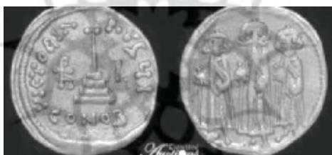
شکل (۲ - الف): دینار اسلامی متأثر از بیزانس

۱. مرحله اول: سال‌های ۷۲ تا ۷۴ هجری است. (۷۴ هجری قیام ابن‌زبیر سرکوب شد) این مرحله خود به دو بخش تقسیم می‌شود. در این دوره تصویر امپراتور بیزانس همچنان مورد استفاده قرار می‌گرفته است و صلیب به شکل «T» تغییر یافت. اما در مرحله بعدی صلیب به شکل «i» و نیز عبارت دعایی یونانی به «بسم الله، لاله الا الله وحده، محمدرسول الله» تبدیل شد. (شکل ۲ - الف و ۲ - ب) ۱ در این مرحله برخی از نقوش روی دینار بیزانسی ویرایش و برخی از نقوش مسکوکات فلس بیزانسی جایگزین آنها شدند. ۲ لازم به‌ذکر است که یکی از مهم‌ترین تغییراتی که در نقوش سکه‌ها رخ داد، شمایل‌شکنی بود؛ بدین معنا که تصویر موجود بر روی سکه‌های قبلی حذف و به‌تدریج به‌جای آن عبارات و شعارهای جدید نوشته می‌شد. باید توجه داشت که در این فرایند سکه در دارالضرب مسلمانان ضرب می‌شد تغییراتی در شکل صلیب و به‌کارگیری نوشته‌های عربی صورت می‌گرفته است.