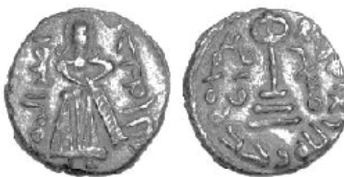
شکل (۸): فیلس اسلامی بیزانسی

قسمت روی سکه: تصویری مشابه عبدالملک بن مروان قرار دارد که در کنار آن عبارت «لِعَبْدِ اللَّهِ عِبْدِ الْمَلِكِ أَمِيرِ الْمُؤْمِنِينَ» نوشته شده است. قسمت پشت سکه: شکلی از صلیب (همانند صلیب شکل شماره ۳) که دورتادور آن عبارت «لَا إِلَهَ إِلَّا اللَّهُ وَحْدَهُ مُحَمَّدٌ رَسُولُ اللَّهِ» نوشته شده است