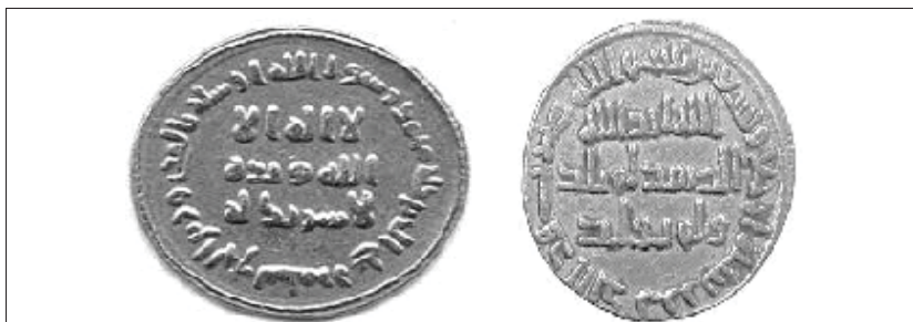
شکل (۴): دینار خالص اسلامی

مرحله سوم: آخرین مرحله از تعریب و اصلاح دینار در اواخر سال ۷۷ ق / ۶۹۷ م به بعد انجام گرفت. در این مرحله دینار خالص اسلامی که تمام نوشته‌هایش به زبان عربی بود ضرب گردید. ۱ (شکل ۴) این سکه‌ها به «سکه‌های اصلاح» یا «بعد از اصلاح» مسکوکات اموی معروف شدند. ۲ شیوه ضرب این دینار تا پایان خلافت امویان (البته با اندکی تغییر) ادامه یافت.