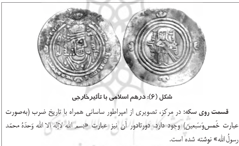
شکل (۶): درهم اسلامی با تأثیر خارجی

مرحله دوم: در این مرحله تصویری شبیه به عبدالملک بن مروان بر روی درهم منقش گردید. در کنار تصویر، با خط کوفی عبارت «أَمِيرَ الْمُؤْمِنِينَ خَلَفْتَنِي بِاللَّهِ» نوشته شد. در روی دیگر درهم نیز سال ضرب آن که ۷۵ ق / ۶۹۵ م است، نگاشته شد. ۲ (شکل ۶) ۳