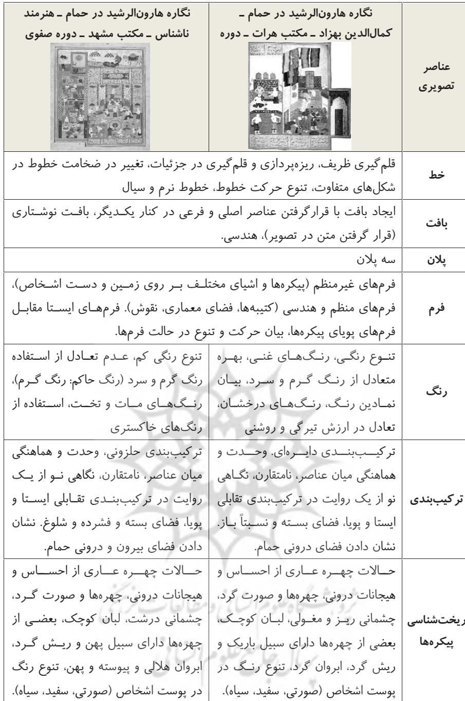
جدول ۱: تطبیق و مقایسه دو نگاره «هارون الرشید در حمام» از لحاظ عناصر و نقش‌مایه‌های تصویری ۱