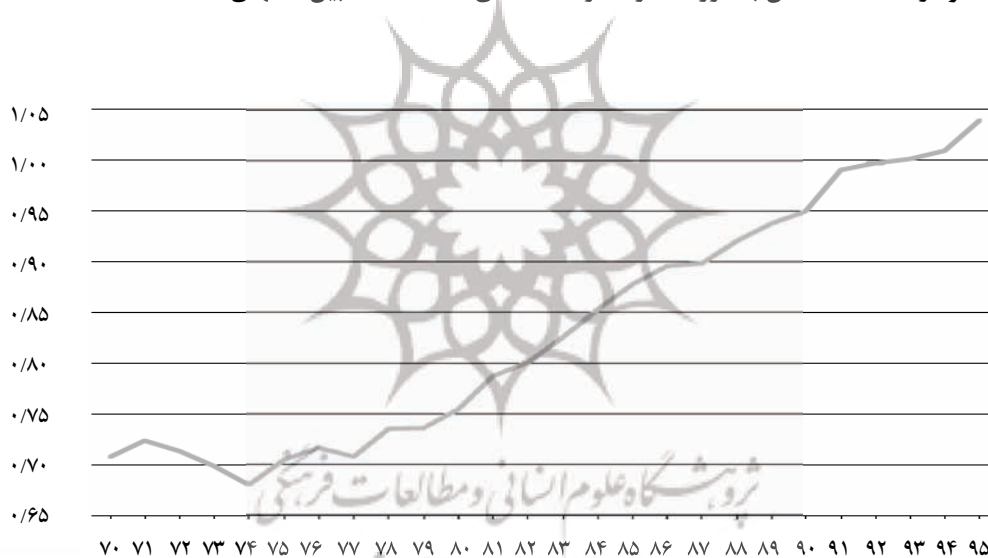
نمودار-۱. شدت دانش به کار رفته در صادرات کالاهای ساخته شده بین سالهای ۱۹۷۰-۱۹۹۵