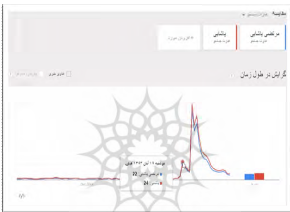
نمودار ۱ - رفتار جست‌وجوی پاشایی از سپتامبر تا نوامبر ۲۰۱۴

جست‌وجو، بررسی کردیم. رفتار جست‌وجوی کاربران فارسی‌زبان گوگل در ماه‌های سپتامبر، نوامبر و اکتبر ۲۰۱۴، مقارن با ماه‌های شهریور، مهر و آبان ۱۳۹۳، درباره واژه‌های «مرتضی پاشایی» و «پاشایی» مطابق نمودار ۱ بود.