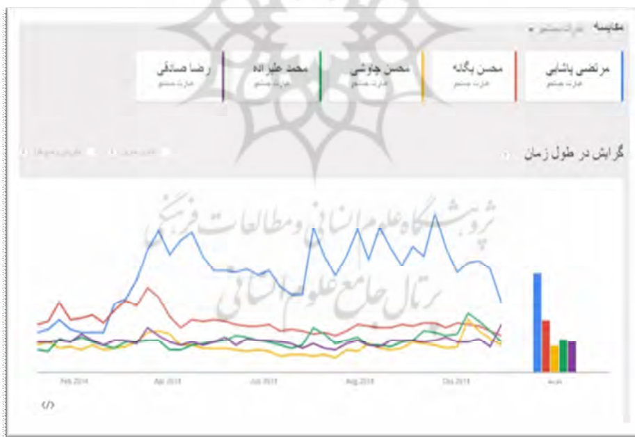
نمودار ۲ - مقایسه رفتار جست‌وجوی خوانندگان پاپ در گوگل از بهمن ۱۳۹۲ تا مهر ۱۳۹۳

نمودار ۲ مربوط به بهمن ۱۳۹۲ تا مهر ۱۳۹۳، یعنی یک ماه پیش از فوت پاشایی است. همان‌طور که در نمودار پیداست میزان توجه کاربران گوگل به پاشایی به یک‌باره افزایش شدیدی می‌یابد و با اختلاف زیادی از سایر خوانندگان پیش می‌افتد. در این ماه‌ها پاشایی با اختلاف زیاد از سایر همکاران خود در کانون توجه طرفداران موسیقی پاپ در اینترنت قرار دارد.