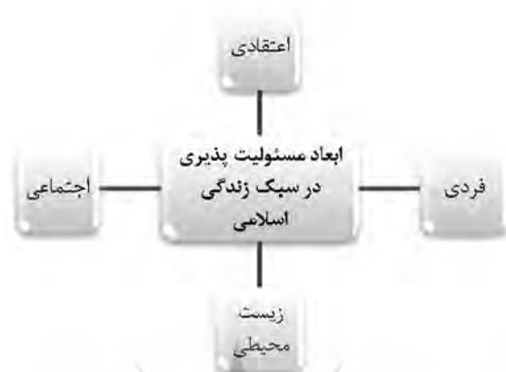
شکل ۱) ابعاد مسئولیت‌پذیری اسلامی