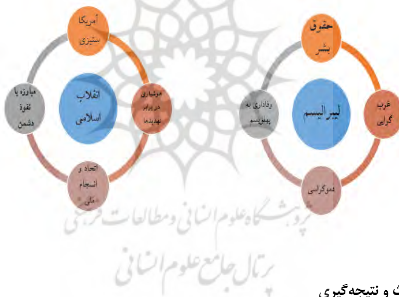
شکل شماره ۱

و پاسخگویی می‌کنند. اتحاد، اعتماد و همدلی، از خصوصیات داخلی و تفرقه، دشمنی و جاسوسی، از خصوصیات خارج نشین‌ها، در اغلب رویکردهای این بخش است. اتاق خبر: رویکرد این بخش خبری اغلب با عناوینی همچون آزادی، حقوق بشر، لیبرالیسم، نبود شفاف‌سازی و وجود فساد در دستگاه‌های ایران، همراه است. همواره مردمان آن در حال یافتن راه‌حلی برای بیرون رفت از این مشکلات هستند و باید به آنها کمک‌های حقوق بشری کرد. پایه‌های این حکومت سست است و در عرصه بین‌المللی و منطقه‌ای به شدت منزوی شده است.