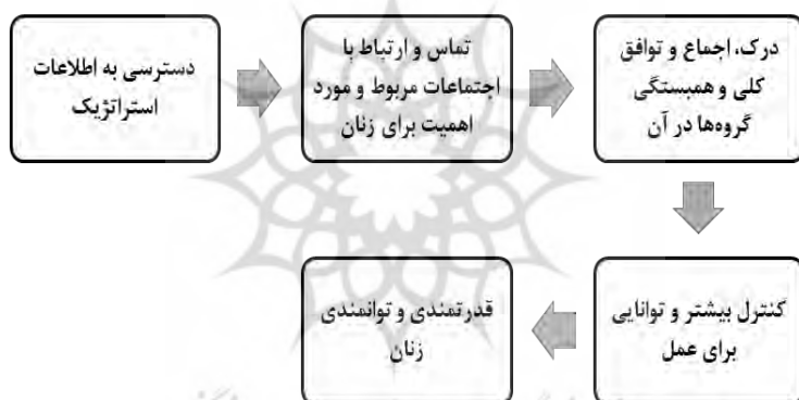
شکل ۱- نقش فاوا در قدرت‌بخشی و توانمندی زنان (Nath, 2001)

در این راستا می‌توان فاوا را یکی از ابزارهای ایجاد عدالت جنسیتی نیز به حساب آورد. فاوا مکانیزم انتقال و ابزار ایجاد ارتباط است و می‌تواند به زنان در فراهم آوردن خدمات، آگاه‌سازی آنان، پایان دادن به انزوای زنان که ریشه در فرهنگ‌ها دارد، کمک کند. به بیان دیگر، با استفاده از فاوا، زنان ضمن حضور فیزیکی در خانه و انجام وظایف خود در قبال خانواده، می‌توانند فعالیت اجتماعی و اقتصادی داشته‌باشند. این امر سبب می‌شود که حتی در جوامعی که از نظر فرهنگی موانعی برای مشارکت زنان در عرصه‌های اجتماعی - اقتصادی وجود دارد، زمینه‌ی حضور آنان فراهم شود (Azizi, 2010). در این رابطه دالی (Daly, 2003) بیان می‌کند که در برخی از جوامع، مشاغلی که فقط مستلزم حضور در مکان‌های مردانه هستند، محدودیت‌هایی را برای زنان به‌وجود آورده‌اند که با پیشرفت فناوری، فاوا این فرصت را برای زنان از طریق تلفن، رایانه و اینترنت فراهم کرده‌است که