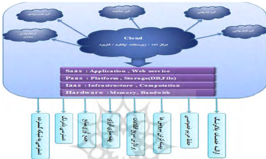
شکل ۱. معماری لایه‌ای و مدل‌های خدماتی استاندارد و مزایای ابر

می‌رود و با استفاده از فناوری‌های مربوط به شبکه خصوصی مجازی (VPN) ۱ صاحبان کسب و کار را قادر می‌سازد که تنظیمات مورد نیاز شبکه از قبیل امنیت و توپولوژی و غیره را انجام دهند (Botta et al. 2015). معماری لایه‌ای و مدل‌های خدماتی استاندارد و مزایای ابر به اختصار در شکل ۱، نشان داده شده است.