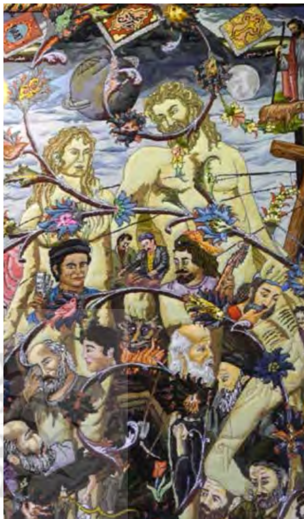
تصویر ۳. بخشی از قالی با عنوان گردش خلقت.

«بدون قابلیت دانش‌اندوزی عاملان، ساختارها و نهادها وجود نخواهند داشت. زیرا معرفت اصل اساسی بازتولید اجتماعی است» (پیرسون، ۱۳۸۴: ۱۴۶). لذا مطالعه کیفیت نظام آموزش هنرمندان طراح و تأثیر آن در نظام طراحی قالی تبریز اهمیت می‌یابد. از منظر جامعه‌شناسی منظور از آموزش، انتقال دانش، مهارت و شیوه کنش‌های متقابل در موقعیت‌های مختلف است تا از این طریق اعضای جدید با چهارچوب‌های جامعه خود آشنا شوند. «جامعه‌شناسان بین آموزش به معنای عام و