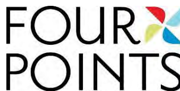
تصویر ۱۰ - شکل هندسی مستطیل هتل‌های زنجیره‌ای فورپوینتس (Four Points Hotels Chain) آمریکا (Ibid).