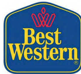
تصویر ۵۵- حضور نماد جهانی ایشیا به عنوان تاج پادشاهی و مخفف حرف W آرم هتل‌های زنجیره‌ای بست وسترن، امریکا (Ibid).

تصویر ۵۸- عدم حضور نماد منطقه ای و جهانی در آرم هتل‌های زنجیره‌ای روتانا (Rotana Hotels Chain)، دبی (Ibid).