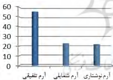
نمودار ۱. فراوانی نوع آرم

دسته‌بندی الف) نخست، برای تقسیم‌بندی نوع آرم‌ها بر حسب ترکیب عناصر زبانی و شمایی در سه گروه تعیین شدند: آرم نوشتاری، آرم شمایی و آرم تلفیقی (تصاویر ۶-۸). آرم‌هایی در گروه «آرم نوشتاری (logotype)» قرار می‌گیرند که فقط از عناصر زبانی استفاده می‌کنند (یک نام کامل - یک یا چند حرف). آرم‌هایی در گروه «آرم شمایی (logoiconique or icotype)» قرار می‌گیرند که با ترکیب عناصر شمایی طراحی می‌شوند. هم‌چنین، آرم‌هایی در گروه «آرم تلفیقی (logomixte)» قرار می‌گیرند که از تلفیق عناصر نوشتاری و شمایی ساخته شده‌اند (پهلوان، ۱۳۹۰: ۳۲). پرسش‌نامه‌هایی که در این پژوهش پاسخ داده شد، مشخص کرد که آرم تلفیقی، با میزان ۵۵/۴۷ درصد بیش‌ترین میزان را دربر دارد؛ آرم شمایی، با میزان ۲۲/۷۲ درصد و آرم نوشتاری، با میزان ۲۱/۸۱ درصد، کم‌ترین آمار را به خود اختصاص داده‌اند (نمودار ۱).