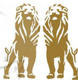
تصویر ۱۷- نقش غالب حیوانی آرم هتل‌های زنجیره‌ای افریکن پراید (African Pride Hotels Chain) آفریقا (Ibid).