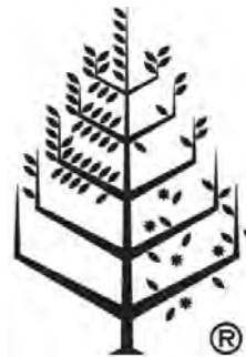
تصویر ۲۵- ترکیب‌بندی متمقارن نسبی هتل‌های زنجیره‌ای فورسیزن (Four Seasons Hotels Chain) کانادا (Ibid).