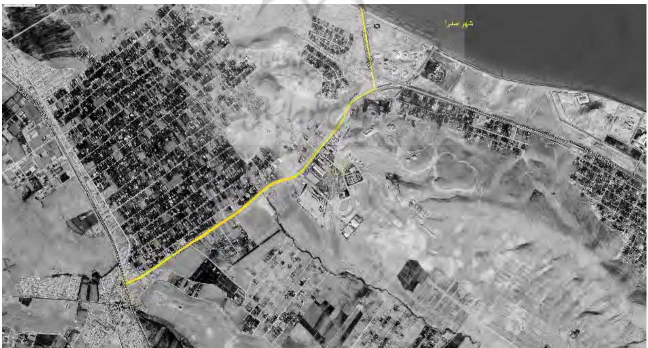
تصویر ۶. شیران صدرا در تطابق کامل با شرایط هویتی و توپوگرافی منطقه منجر به جذب بیشتر مردم و افزایش فضاهای عمومی شده است.