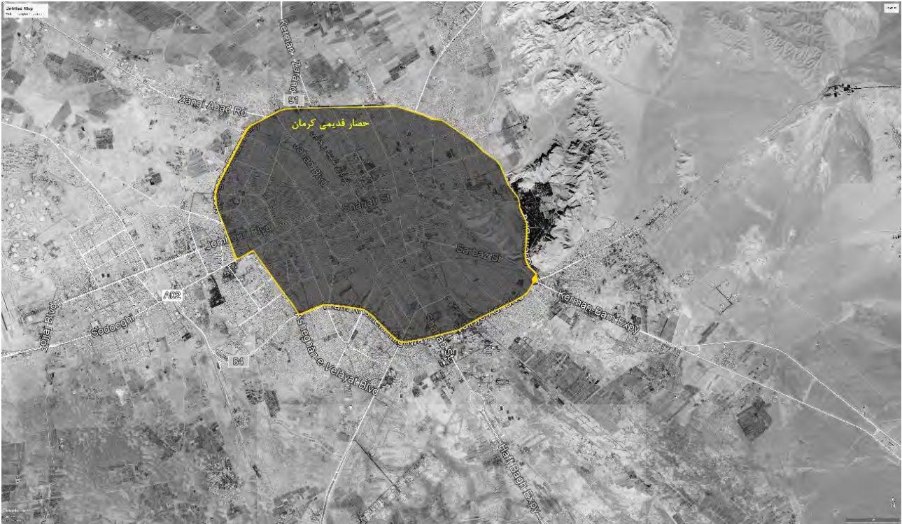
تصویر ۲. شهر قدیم کرمان در محدودهٔ حصار قدیمی قرار گرفته است.