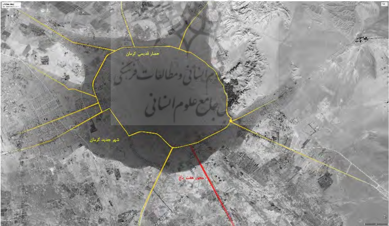
تصویر ۳. لکه‌گذاری فضاهای شهری در امتداد شریان‌های شهری نشان می‌دهد که توسعهٔ شهر در جهت محورهای ارتباطی است.