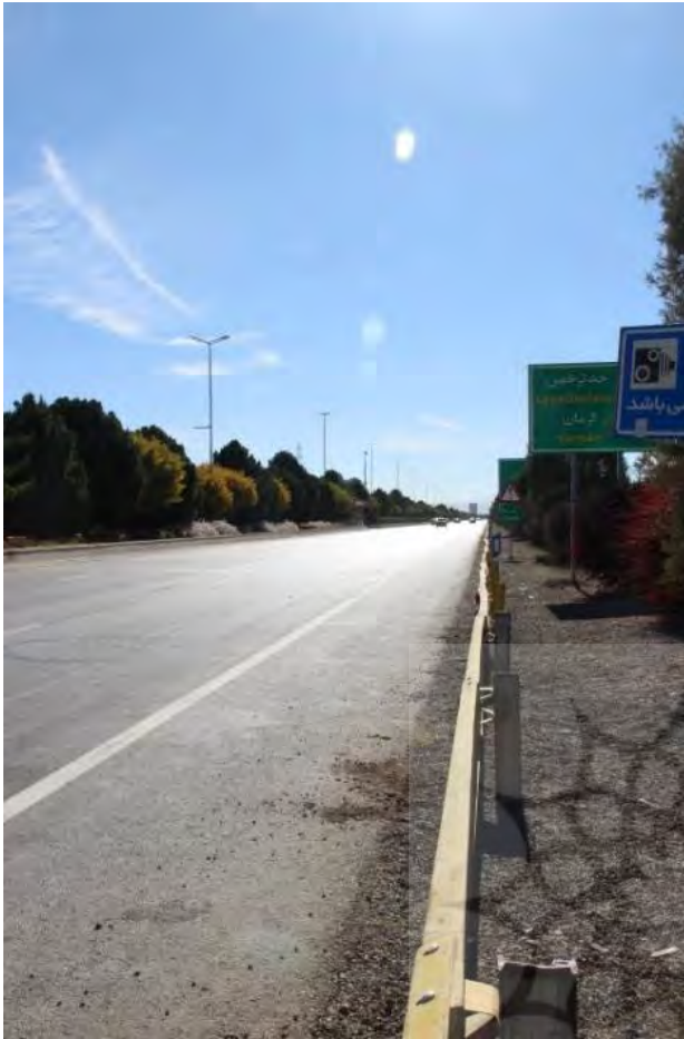
تصویر ۴. هفت باغ شریانی ناهمساز با اقلیم و خاطره جمعی. هفت باغ کرمان. عکس: شیوا افشاری، ۱۳۹۶.

ناهماهنگ با معماری بومی کرمان و اقلیم مناطق کویری، ایجاد جداره‌های بسته در حاشیه مسیر و قطع ارتباط با طبیعت، جانمایی بلافصل و نامناسب فضای سکونت در حاشیه مسیر تردد سواره با سرعت بالا موجب شده است که این شریان مورد استقبال و استفاده عموم مردم به عنوان فضای تفریحی قرار نگیرد. این امر ممکن است روند توسعه به سمت محور هفت‌باغ را نیز مختل سازد.