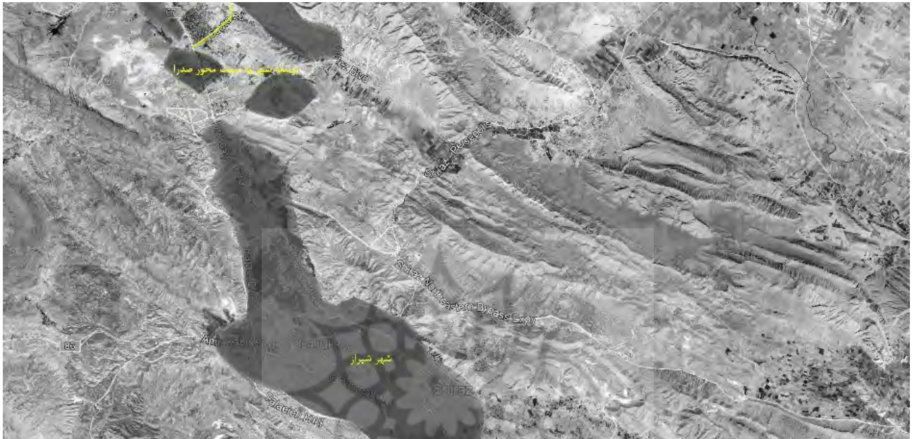
تصویر ۵. موقعیت محور صدرا نسبت به شهر شیراز و توسعه شهر به سمت آن محور.

را برای سکونت قشر متوسط جامعه با درآمد پایین فراهم آورده و افراد زیادی را به خود جذب کرده است. شیران صدرا در ابتدا صرفاً نقش ارتباطی میان صدرا و شیراز را داشت اما پس از گذشت چند سال به دلیل ایجاد کاربری‌های متنوع تجاری، درمانی، آموزشی و تفریحی در کنار این