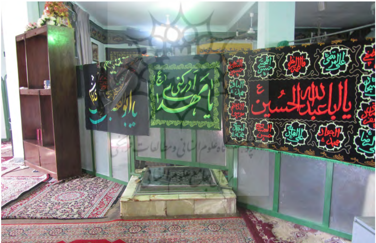
تصویر ۲. طبیعت‌گرایی منظر آیینی در قالب حفظ عنصر آب (چاه) در میان شبستان، مسجد صاحب‌الزمان جوپار کرمان. عکس: حمیده ابرقویی فرد، ۱۳۹۶.