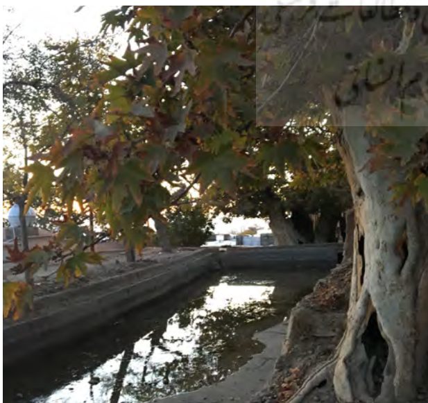
تصویر ۵. شکل‌گیری مرکز کالبدی و معنایی روستا در مجاورت منظر آیینی. روستای تیکدر کرمان. عکس: حمیده ابرقویی فرد، ۱۳۹۶.

منظر آیینی روستای تیکدر واقع در استان کرمان حکم