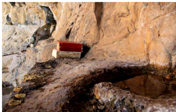
تصویر ۳. تداوم طبیعت‌گرایی منظر آیینی مهرابه روستای کهنوج پس از تغییر عملکرد آن به یک نیایشگاه اسلامی. عکس: نرگس قدیانی، ۱۳۹۶.

منظر آیینی بقعه شاه نعمت‌الله ولی در شهر ماهان نمونه‌ای از مناظر آیینی است که در آن ابعاد اجتماعی آیین‌ها در کنار طبیعت‌گرایی فضای بقعه، کیفیت مناسب محیطی را برای شکل‌گیری سنت زیارت-تفرج فراهم آورده است (تصویر ۴). امروزه تصمیم‌های مدیریتی در شهر ماهان در تضاد با نقش اجتماعی بقعه بوده و منظر آیینی بقعه شاه نعمت‌الله ولی، عملکرد تفرجی گذشته خود را ندارد و بعد اجتماعی آیین‌ها -که یکی از دلایل اثرگذاری و تداوم مناظر آیینی محسوب می‌شود- مورد غفلت قرار گرفته است. حیاط بقعه دیگر مانند گذشته به‌عنوان ظرفی برای یکی‌شدن افراد با یکدیگر در قالب باورهای مشترک عمل نمی‌کند و تفرج در نواحی دیگر شهر و به صورت منفک از زیارت انجام می‌پذیرد و سنت زیارت-تفرج که تا پیش از این فرهنگی برخاسته از تمایلات اجتماعی ساکنان بوده در تضاد با سیاست‌های حاکم بر جامعه به ضدارزش تبدیل شده است.