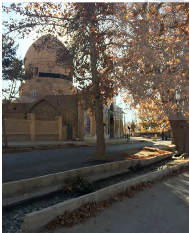
تصویر ۷. شکل‌گیری مرکز نقل معنایی و اجتماعی روستا در قالب منظر آیینی در قسمت ورودی آن متأثر از عوارض زمین. روستای سه‌کنج کرمان. عکس: حمیده ابرقویی فرد، ۱۳۹۶.

شیوه دیگر اثرگذاری مناظر آیینی بر منظر شهر کرمان، به شکل برگزاری آیین‌های عزاداری در بازار و مجموعه گنجعلی‌خان قابل شناسایی است. ویژگی‌هایی نظیر تکرارپذیری در مکان و زمان مشخص و ماهیت نمادین و اجتماعی سبب ارتباط و تعامل آیین‌ها با سه مؤلفه اصلی شهر یعنی کالبد، معنا و فعالیت می‌شود (علی‌الحسابی و پای‌کن، ۱۳۹۴: ۷۷). آیین‌های عزاداری ماه محرم با تکرار هرساله