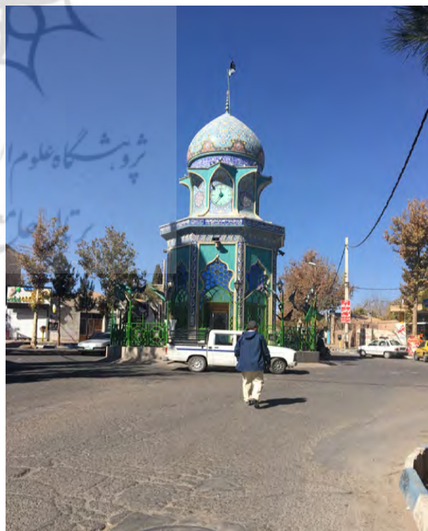
تصویر ۸. شکل‌گیری مرکز اجتماعی و عملکردی شهر در محل منظر آیینی امامزاده شیرخدا، راین کرمان. عکس: حمیده ابرقویی فرد، ۱۳۹۶.