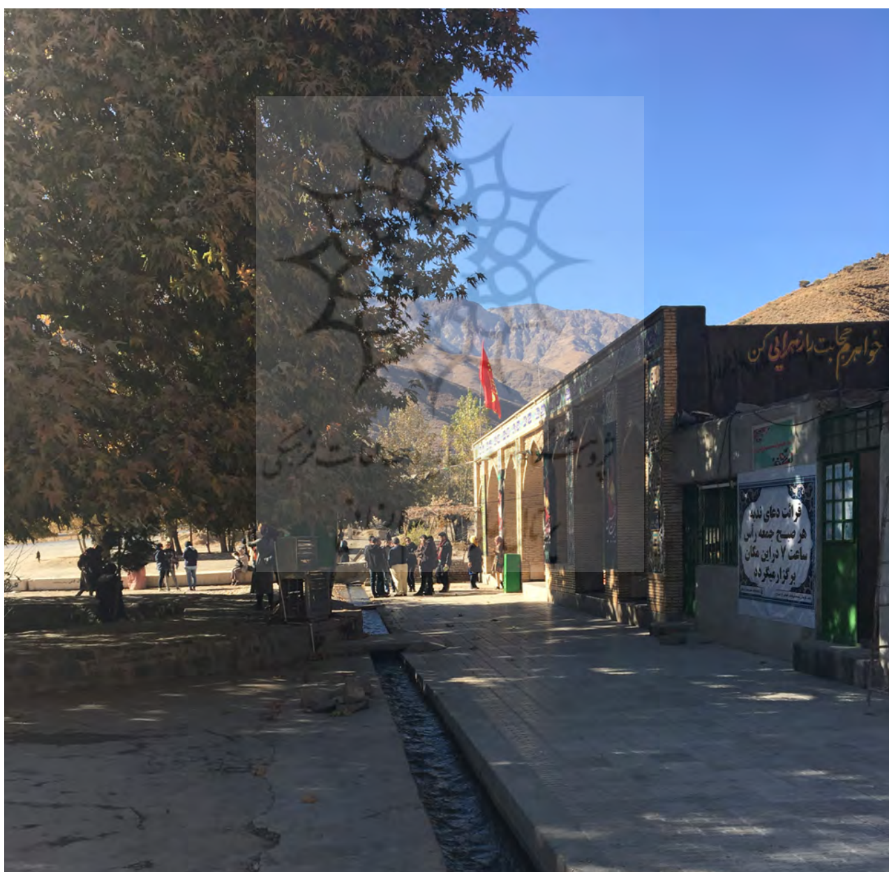
تصویر ۸. منظر آیینی به عنوان نقطه عطف کالبدی و معنایی در فضای بکر و طبیعی. جاده کرمان به روستای سیرج، عکس: حمیده ابرقویی فرد، ۱۳۹۶.

آنان با اسطوره‌ها و باورهای دین جدید، تداوم آن را در طول زمان تضمین کرده‌اند. در طول زمان ساختارهای ذهنی ایرانیان از یک فضای مطلوب، در قالب الگوی کالبدی طبیعت‌گرای این مناظر شکل گرفته و تبلور عقاید و باورهای مشترک جامعه در قالب آیینها به مناظر آیینی، نقش فعال اجتماعی بخشیده است. همچنین بروز عقاید مشترک افراد جامعه به شیوه‌ای جمعی در کنار ویژگی‌های طبیعت‌گرایانه، زمینه‌ساز تداوم و استمرار مناظر آیینی و اثرگذاری آنها بر منظر شهر ایرانی و حیات اجتماعی ساکنین آن است.