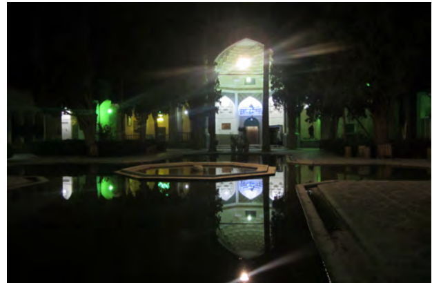
تصویر ۴. کیفیت فضایی ناشی از هم‌نشینی عناصر سه‌گانه منظر آیینی به عنوان بستر شکل‌گیری سنت زیارت-تفریح. بقعه شاه نعمت‌الله ولی کرمان. عکس: حمیده ابرقویی فرد، ۱۳۹۶

مکان‌یابی مناظر آیینی که جوهره مکانی دلخواه را در ساختارهای ذهنی ایرانیان تشکیل می‌دهند، در حوزه روستا متأثر از عوارض زمین و محدودیت‌های آن بوده و گاه سبب می‌شود که این مناظر جدا از منظر روستا شکل بگیرند. در روستای سه‌کنج به دلیل قرارگیری روستا در شیب و