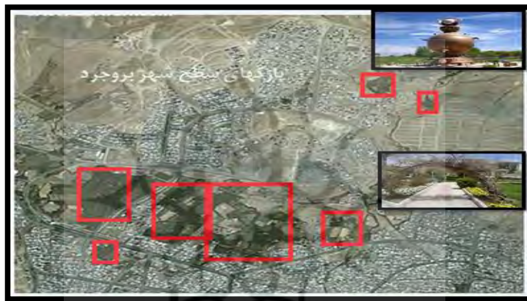
تصویر شماره ۱: پارکهای سطح شهر بروجرد