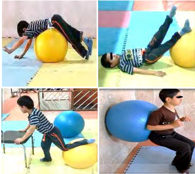
شکل ۳. نمونه‌هایی از تمرینات انجام شده

در تحقیق حاضر برای طبقه‌بندی و خلاصه‌سازی اطلاعات از آمار توصیفی، میانگین و انحراف معیار و برای تحلیل داده‌ها از آزمون t وابسته در سطح معناداری ( P \leq 0/05 ) در نرم افزار آماری SPSS نسخه ۲۲ استفاده شد.