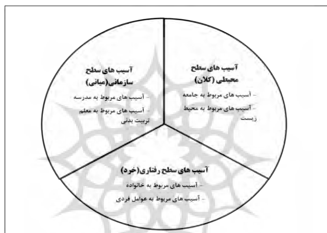
شکل ۱- مدل سه شاخه‌ای آسیب‌های تربیت بدنی و ورزش مدارس (مدل سطح صفر پژوهش)

پرداخته شده و سعی شده است که در پایان، آسیب‌های موجود در قالب یک مدل شرح داده شوند؛ براین اساس و براساس مطالعه مبانی نظری پژوهش (جوادی پور، ۱۳۸۵؛ هاشمی، ۱۳۹۳؛ قاسمی، ۱۳۹۳؛ احمدی، ۱۳۹۳؛ چمبرز، ۱۹۹۱؛ دنیز و یئل، ۲۰۱۳؛ آمایاکاستلانوس، شمله‌لوی، اسکالانتیه-زتا، مورالس‌روان، جیمینز آگولیار، سالازار کرنل و آمایاکاستلانوس، ۲۰۱۵؛ کوبل، کتنر، کستایز، ارکلنز، درنواتز و استینکر، ۲۰۱۵؛ گرینفیلد، الموند، کلارک و ادواردز، ۲۰۱۶؛ پاول، وودفیلد و نویل، ۲۰۱۶ و غیره، مدل سطح صفر پژوهش به صورت زیر بنا نهاده شد: