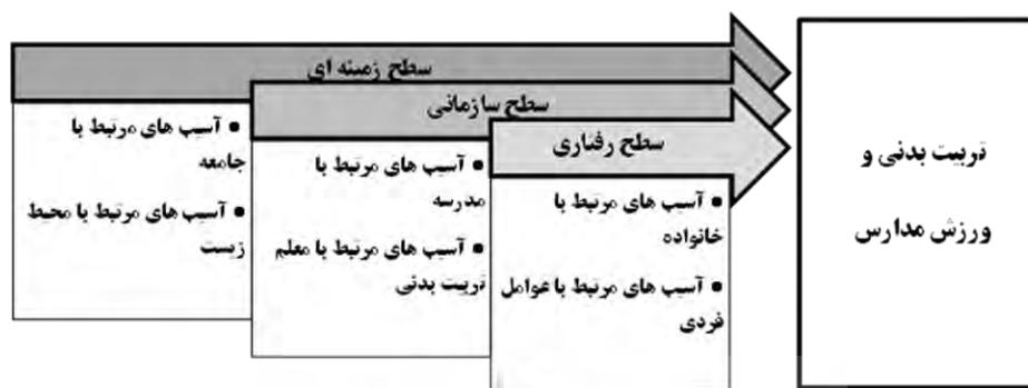
شکل ۳- مدل آسیب‌های تربیت‌بدنی و ورزش مدارس ابتدایی خوزستان