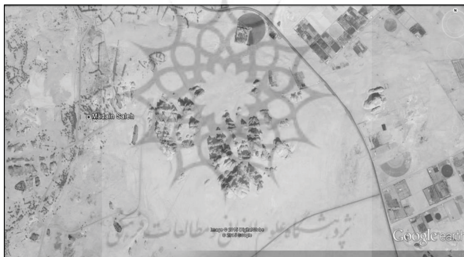
پیوست ۳. نحوه قرار گرفتن کوه‌ها در منطقه بیابانی در حجر در عکس ماهواره‌ای تهیه شده از: Google earth