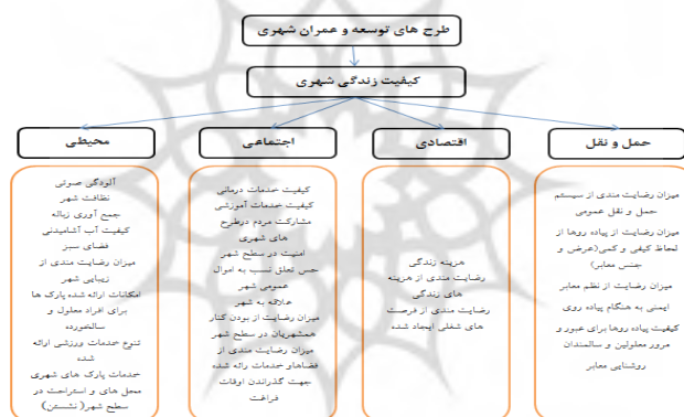
شکل (۱): متغیرهای و شاخص‌های مورد استفاده در پژوهش

روش تحلیل آمار استنباطی و تحلیل متغیرها: در این قسمت از آزمون کلموگروف اسمیرنوف (K-S) برای تأیید یا عدم تأیید توزیع نرمال بودن داده‌ها، و برای تحلیل آزمون فرضیه‌های تحقیق از آزمون یومن ویتنی، آزمون تحلیل واریانس یکطرفه و آزمون تی تک نمونه‌ای استفاده شد. مهم‌ترین شاخص‌هایی که برای ارزیابی اثرات طرح‌های عملیاتی (موضوعی و موضعی) بر کیفیت زندگی شهروندان ساری در نظر گرفته شده بدین شرح می‌باشد.