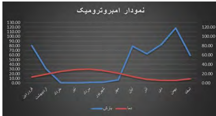
شکل (۱): نمودار آمپروترومیک شهر ایلام