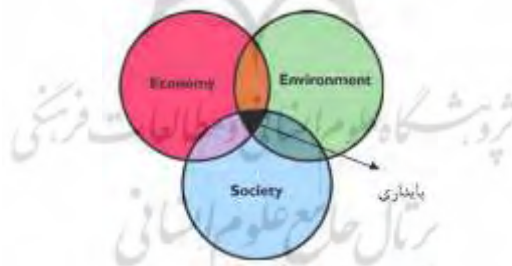
نمودار ۳: دیاگرام سه بعد اصلی توسعه پایدار، (منبع: پاکزاد، ۱۳۸۳: ۴۶).

از حدود ۲۰ سال پیش سازمان ملل از کشورهای مختلف جهان خواست با اتخاذ استراتژی‌های ملی توسعه پایدار، سیاست‌های هماهنگی را در این زمینه دنبال نمایند. از آن زمان تعدادی از کشورها رویکردهای استراتژیکی را برای توسعه پایدار در سطح ملی طراحی کرده و به اجرا درآوردند؛ اما تعدادی دیگر، هنوز در ابتدای راه هستند. ایران در زمره کشورهایی است که برنامه ریزی اقتصادی را قبل از سایر کشورهای در حال توسعه آغاز کرد/ جریان نوسازی نیز در برنامه های توسعه کشور با جدیت دنبال شد. هرچند ایران در زمینه توسعه پایدار تاکنون استراتژی مستقلی را به صورت جامع و چندوجهی دنبال نموده اما مکانیسم‌های دیگری را مورد توجه قرار داده که احتیاجات یک استراتژی توسعه پایدار را برآورده می‌سازد. برنامه‌های توسعه پنج ساله، برنامه‌هایی هستند که توسط دولت باهدف تحقق توسعه‌ای منظم و هماهنگ از نظر اقتصادی، اجتماعی، سیاسی و فرهنگی تدوین و اجرا می‌شود (حبیب، ۱۳۸۷: ۲-۱۳).