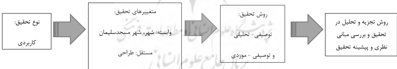
نمودار ۱: روند پژوهش، (منبع: نگارندگان، ۱۳۹۷).

با توجه به سنجش شهرها، خصوصا شهرهایی با قدمت تاریخی و فرهنگی بی‌نظیر در دنیا و وام‌گرفتن از مفاهیم و رویکردهای پایداری اجتماعی ضرورت ایجاد می‌کند مصداق‌هایی را جهت تحلیل ویژگی‌های مناسب شهرهای تاریخی و فرهنگی در دنیا و همچنین مفاهیم و الگوهای پایداری اجتماعی را انتخاب کرده و از نتیجه این سنجش‌ها، مقایسه‌ای را به دست آورده که نتیجه‌گیری ارائه می‌گردد، پس به طور کل روش تحقیق استفاده شده، روش تحقیق توصیفی-تحلیلی و توصیفی-موردی می‌توان نام برد. اطلاعات مربوط به ادبیات موضوع و پیشینه پژوهش با استفاده از روش‌های کتابخانه‌ای، اسنادی و منابع مکتوب نظیر مقالات متعدد، پایان‌نامه‌های مربوطه، کتاب‌های نگاشته شده در رابطه با موضوع پژوهش و اطلاعات مرتبط با تأیید یا رد فرضیه‌های پژوهش، اهمیت موضوع مورد بررسی قرار خواهد گرفت.