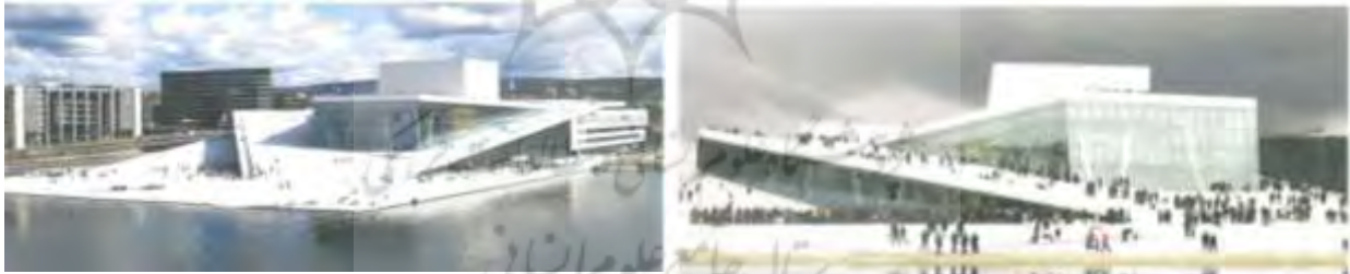
تصویر ۱: فضای فرهنگی سرزنده شهری، (منبع: بهزادفر و طهماسبی، ۱۳۹۲: ۱۷-۲۸).

با توجه به معنی واژه پایداری به معنای دوام و ماندگاری در گذر زمان، تعریف دیگری که می‌توان برای پایداری در حوزه اجتماعی بیان کرد، ماندگاری فضا بین مردم در طول زمان می‌باشد، هم در زمان حال و هم در آینده. یعنی فضا باید به گونه‌ای باشد که کارکردهای خود را در گذر زمان حفظ نماید و همیشه پر از حضور مردم و بستر شکل‌گیری فعالیت‌ها در طیف سنی و جنسی مختلف می‌باشد و پاسخگویی به نیازهای مختلف آن‌ها زمینه را برای حضور و مکث برقراری مرادوات اجتماعی آن‌ها فراهم آورد که این همان تعریف پویایی و سرزندگی فضایی است. به عبارت ساده فضایی که به لحاظ حضور مخاطب سرزنده و پویا باشد، به لحاظ اجتماعی نیز پایدار است (بهزادفر و طهماسبی، ۱۳۹۲: ۱۷-۲۸).