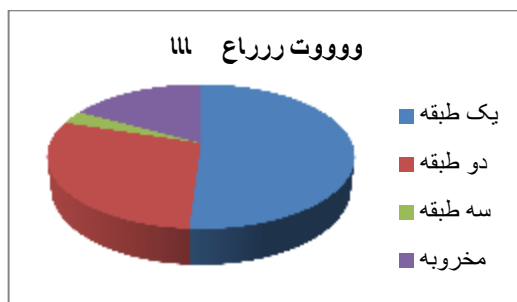
نمودار ۷- وضعیت ارتفاع بناها- (منبع: نگارنده)