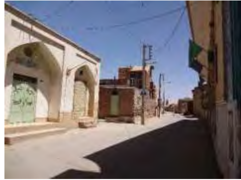
تصاویر ۳ و ۴ بافت تاریخی شهرستان گز