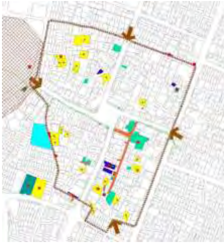
نقشه ۲- مسیرهای ورود به بافت قدیمی