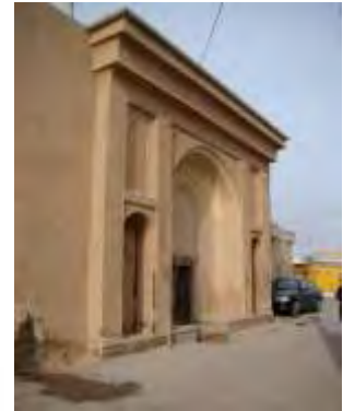
تصویر ۵- سردر خانه تاریخی امینیان