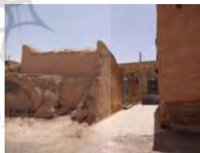
تصاویر ۹ و ۱۰- تخریب بناهای تاریخی به دلیل عدم حفاظت و ساماندهی