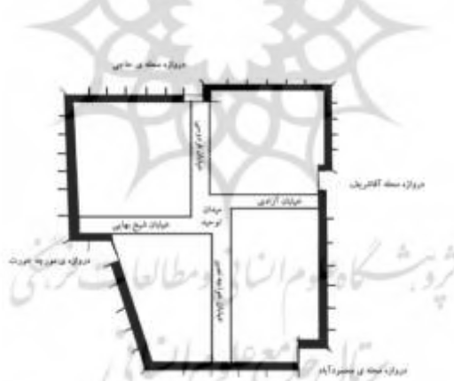
نقشه ۳- فرم قلعه مانند شهر (منبع: یزدانی گزی، ۱۳۹۰)

سبک معماری خانه ها و محلات گز (بر اساس سنت معماری کلی ایران قدیم) به این طریق بوده است که در داخل قلعه و دژ نیز نوعی دژهای کوچک تر وجود داشته و این مورد تا حدود ۴۰ الی ۵۰ سال قبل تا زمانی که شهرداری گز تاسیس گردید، مشاهده می شد. معمولا چند خانه که افراد نزدیک به هم در آن زندگی می کردند، راه هایش به یک درب بزرگ تر منتهی می شد که در مواقع لزوم بسته می شد و نیز در بین کوچه ها اکثرا سقف وجود داشت و روی این سقف ها که راهی به خانه ها داشته، اتاق هایی می ساخته اند و بطور کلی از زمین موجود در دژ و قلعه نهایت استفاده را می کرده اند. کوچه ها به طریقی بوده که در زمستان از باران و برف مصون بوده و در تابستان بیشتر مسیرها سایه دار بوده است (یزدانی گزی، ۱۳۹۰، ۱۵۸). در حال حاضر از قلعه ی گز جز چند بارو و دیوار چیز زیادی باقی نمانده است. خانه های این شهر در داخل قلعه ساخته شده و این قلعه با داشتن ۴ در، در محلات مختلف به بیرون راه داشته است. این قلعه با دارا بودن دیواری به ضخامت ۷ تا ۹ متر و ارتفاع ۱۲ متر و داشتن باروهایی در فواصل معین از یکدیگر برای نگهداری، محل امنی برای زندگی ساکنین این آبادی در زمان های دور فراهم نموده. به طوری که در حمله افغان ها مانع از تصرف این شهر به دست آن ها شده است. لازم به توضیح است که دروازه های قلعه شامل دروازه های محمودآباد، حاجی و آشریف بوده اند و ورودی دیگر به قلعه دربی کوچکتر و دارای اهمیت کمتری می باشد.