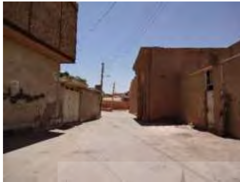
تصویر ۶- موقعیت خانه تاریخی امینیان و ساختمان های همجوار