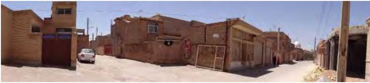
تصویر ۲- بخشی از محدوده تاریخی