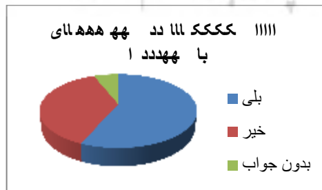
نمودار ۱- آیا مایلید در اجرای راهکارهایی که ارائه می دهید با شهرداری همکاری نمایید؟

به جهت تصمیم گیری جهت بهترین نوع مداخله و رضایت مندی افراد ساکن در بافت لازم است تا در ابتدای هر نوع تصمیم در مورد بافت های تاریخی اطلاعاتی در مورد وضعیت کنونی بافت داشته باشیم به همین جهت در سال ۱۳۹۵، نظر سنجی از اهالی محله گز جهت احیاء و مرمت بافت فرسوده توسط نگارنده به عمل آمد که در قالب نمودارهای زیر عنوان گردیده است: