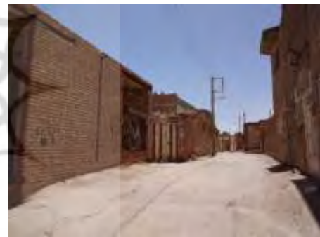
تصاویر ۷ و ۸- بافت تاریخی شهرستان گز