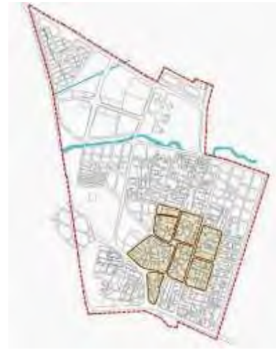
نقشه ۱- محدوده بافت تاریخی شهرستان گز

سبک معماری خانه ها و محلات گز (بر اساس سنت معماری کلی ایران قدیم) به این طریق بوده است که در داخل قلعه و دژ نیز نوعی دژهای کوچک تر وجود داشته و این مورد تا حدود ۴۰ الی ۵۰ سال قبل تا زمانی که شهرداری گز تاسیس گردید، مشاهده می شد. معمولا چند خانه که افراد نزدیک به هم در آن زندگی می کردند، راه هایش به یک درب بزرگ تر منتهی می شد که در مواقع لزوم بسته می شد و نیز در بین کوچه ها اکثرا سقف وجود داشت و روی این سقف ها که راهی به خانه ها داشته، اتاق هایی می ساخته اند و بطور کلی از زمین موجود در دژ و قلعه نهایت استفاده را می کرده اند. کوچه ها به طریقی بوده که در زمستان از باران و برف مصون بوده و در تابستان بیشتر مسیرها سایه دار بوده است (یزدانی گزی، ۱۳۹۰، ۱۵۸). در حال حاضر از قلعه ی گز جز چند بارو و دیوار چیز زیادی باقی نمانده است. خانه های این شهر در داخل قلعه ساخته شده و این قلعه با داشتن ۴ در، در محلات مختلف به بیرون راه داشته است. این قلعه با دارا بودن دیواری به ضخامت ۷ تا ۹ متر و ارتفاع ۱۲ متر و داشتن باروهایی در فواصل معین از یکدیگر برای نگهداری، محل امنی برای زندگی ساکنین این آبادی در زمان های دور فراهم نموده. به طوری که در حمله افغان ها مانع از تصرف این شهر به دست آن ها شده است. لازم به توضیح است که دروازه های قلعه شامل دروازه های محمودآباد، حاجی و آشریف بوده اند و ورودی دیگر به قلعه دربی کوچکتر و دارای اهمیت کمتری می باشد.