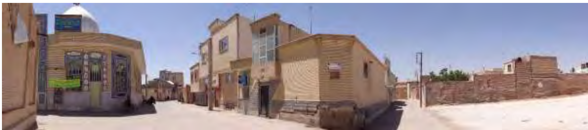
تصویر ۱- بخشی از محدوده تاریخی