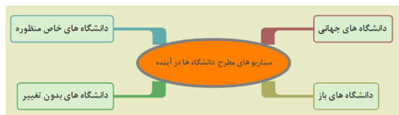
تصویر ۱: سناریوهای مطرح در حوزه دانشگاه‌های آینده

و با یک شیب ملایم خود را با تغییرات هماهنگ ساخته و تغییرات ماهوی جدی نخواهند داشت. برخی دانشگاه‌ها این سناریو را BAU می‌نامند که مختصر عبارت Business As Usual بوده و بر این نکته تأکید دارند که دانشگاه‌ها طبق روال سابق خود به فعالیت ادامه می‌دهند و تنها برخی از ابزارهای مورد استفاده آنان تغییر خواهد کرد. تصویر ۱ سناریوهای دانشگاه‌های آینده را به صورت کلی نمایش می‌دهد.