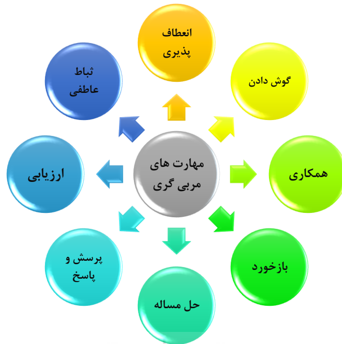
تصویر ۲: مؤلفه های مهارت مربی گری